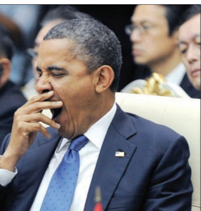
الرئيس الأميركي باراك أوباما يتناول وجبة مع مسؤولين في كمبوديا

المشاكل الأمنية اثارة للشقاق والفرقة في آسيا، وتطالب بروناي وتايوان وماليزيا أيضا بالسيادة على أجزاء من بحر الصين الجنوبي. وازدادت العلاقات بين الصين واليابان توترا بعد أن اشترت الحكومة اليابانية جزرا متنازعا عليها اليابان باسم سينكاكو في اليابان ودياويو في الصين من مالها الياباني في سبتمبر الماضي ما أثار احتجاجات عنيفة ومطالبات بمقاطعة المنتجات اليابانية في الصين. وقال سفير العربي رئيس جمعية ولاء السياحة والسفر انه يوجد تخوف لدى أصحاب شركات السياحة في الأردن من الغاء الحجوزات لما له من تأثير سلبي واضح على الإيرادات.