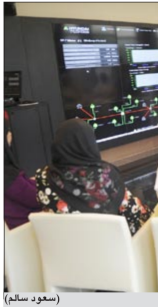
مدير عام «الوطنية للأوفست» يقدم شرحاً للمقر الكوري عن المشروع

كما قام المسؤولون في المشروع بتقديم إيجاز كامل عن الإجراءات الحالية والمتعلقة باستكمال تعيين الكوادر الوطنية وبدء تنفيذ البرنامج التأهيلي والتدريبي على مختلف التقنيات ومهنجات العمل الحديثة التي تستخدمها وتبنيها الشركة في مختلف أعمالها ومشاريعها الحالية والمستقبلية.