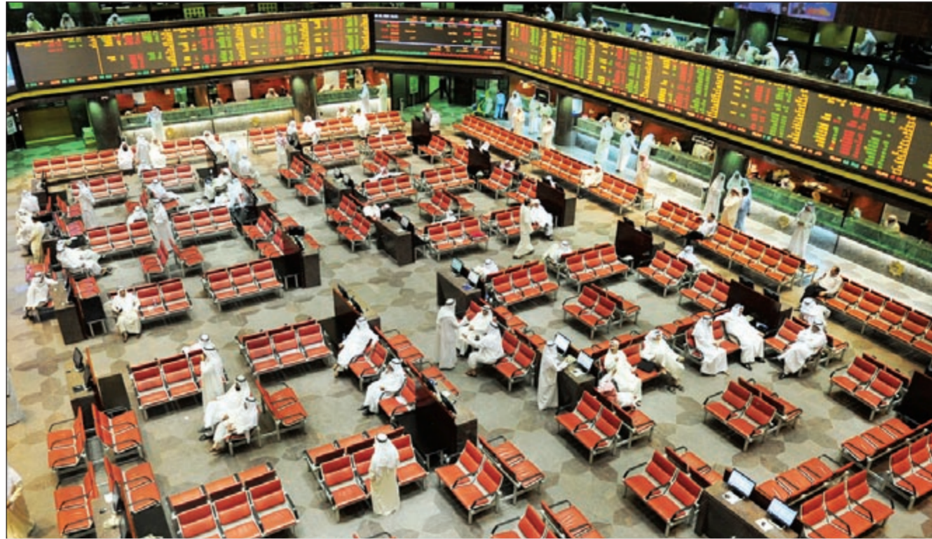
(إسامة أبو عيطية)