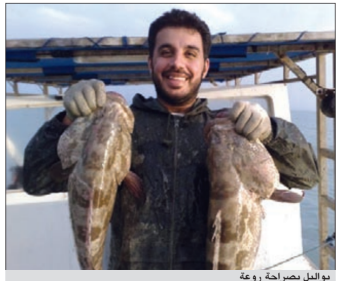
بواليل بصراحة روعة

● لا يوجد شيء اسمه حدائق شمال وجنوب الحدائق حدائق سواء كان بالشمال أو الجنوب أو حتى خارج الكويت، فالصيد لا يعتمد على مكان معين ولكن لكل واحد سمكة معينة يجب ان يتبعها أينما ذهب ويحسب لموسمها ومايتها