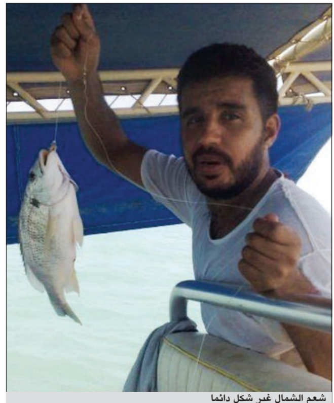
شعم الشمال غير شكل دائما