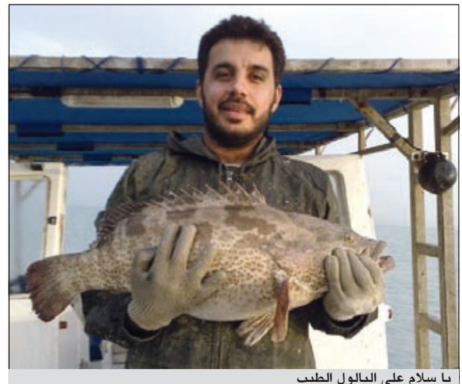
يا سلام على البالول الطيب