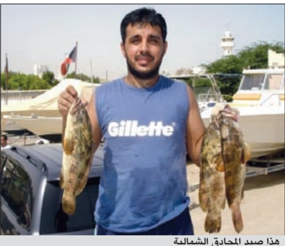
هذا صيد المحادق الشمالية