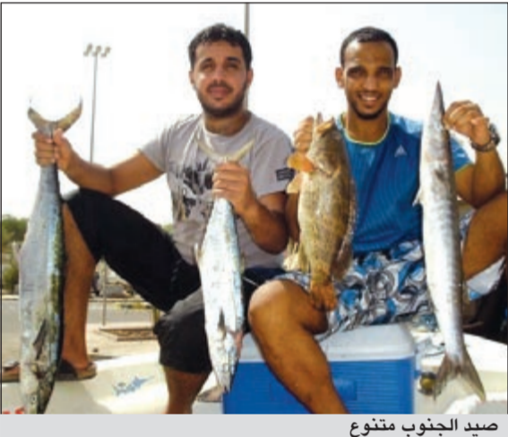
صيد الجنوب متنوع