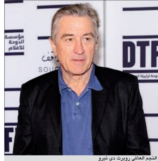
النجم العالمي روبرت دي نيرو

تعرف ضيوف مهرجان الدوحة السينمائي الرابع على مسيرة النجم العالمي روبرت دي نيرو، وذلك من خلال أمسية حوارية جميلة احتضنها مسرح «الريان» بسوق «واقف» مساء أمس الأول.