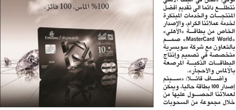
100% ألماس، 100 فائز.