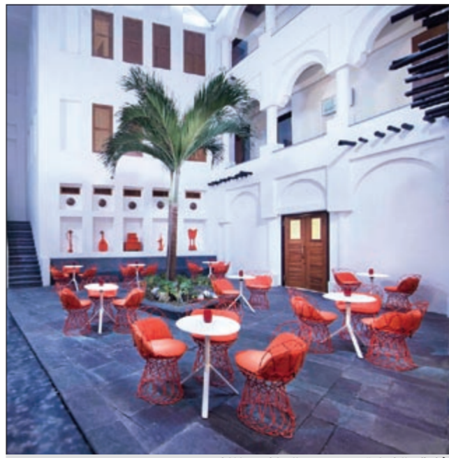
فندق «النجادة» يمزج بين الحاضر والماضي