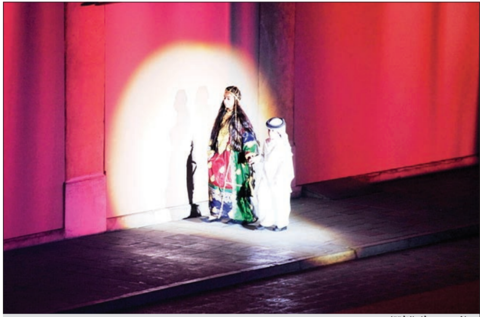
جانب من حفل الافتتاح