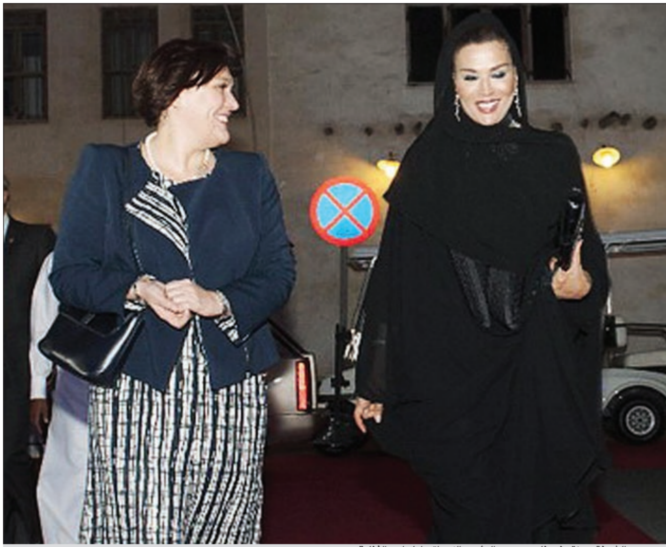
.. وسمو الشيخة موزة بنت ناصر ورحم الرئيس الكرواتي امام احد الفنادق