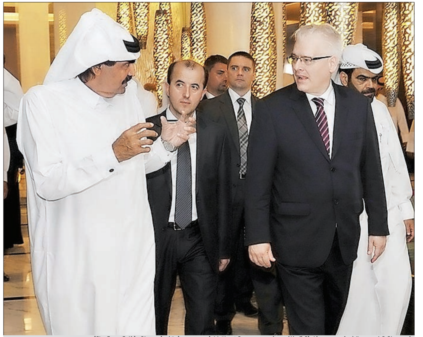
امير دولة قطر سمو الشيخ حمد بن خليفة آل ثاني ورئيس جمهورية كرواتيا ايفو جوسيبوفيتش في جولة بفنادق سوق واقف