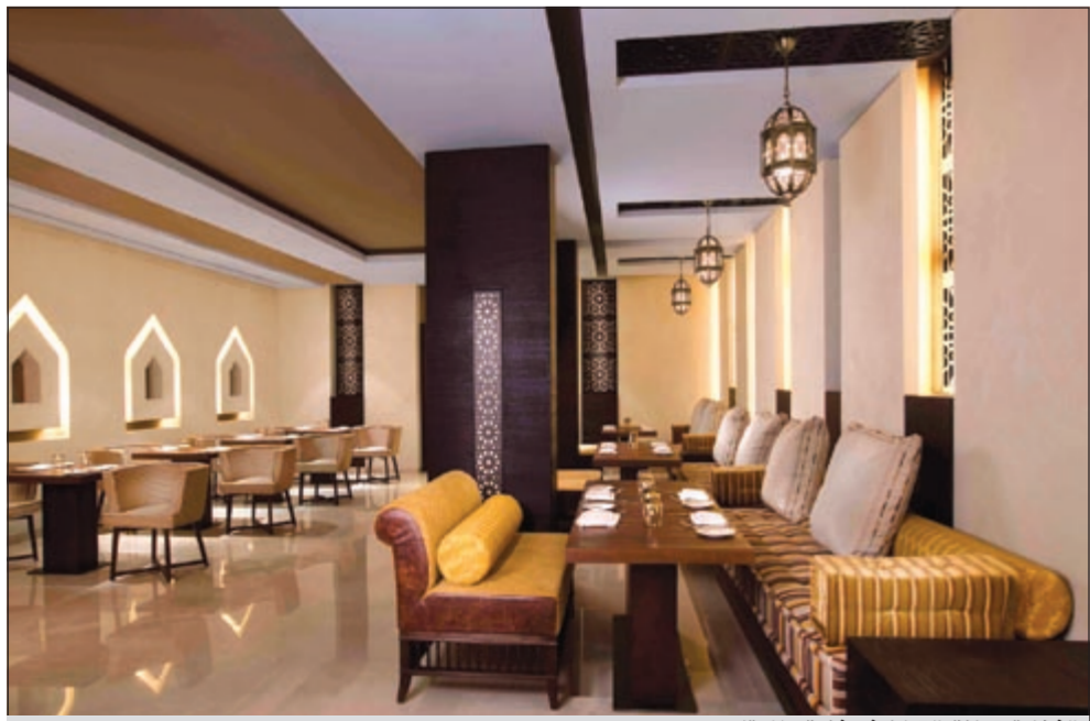
الفخامة تعانق التراث في فندق «المرقاب»