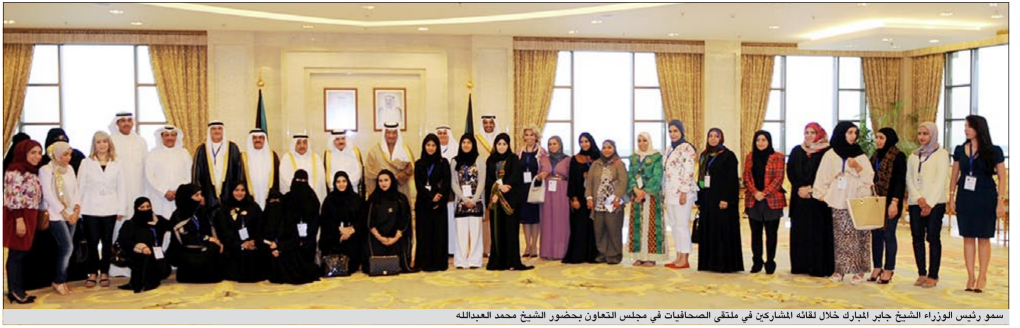
سمو رئيس الوزراء الشيخ جابر المبارك خلال لقائه المشاركين في ملتقى الصحافيات في مجلس التعاون بحضور الشيخ محمد العبدالله

السيف امس وزير خارجية أرمينيا ادوارد نالبايديان، وحضر المقابلة مدير إدارة أوروبا بوزارة الخارجية السفير وليد الخبيزي، كما استقبل سمو رئيس مجلس الوزراء الشيخ جابر المبارك صباح امس في قصر السيف عمدة روتردام في مملكة هولندا احمد أبوطالب. حضر المقابلة محافظ الأحمدية الشيخ د.إبراهيم الدعيج.