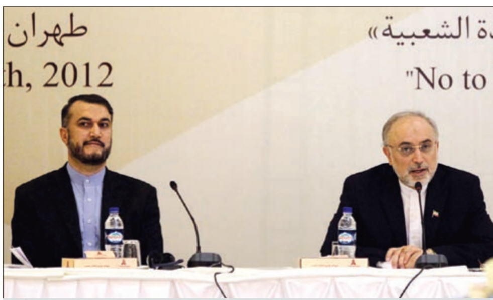
وزير الخارجية الإيراني علي أكبر صالحى مترتسا مؤتمر «الحوار الوطني» السوري في طهران

السورية تشترك في مؤتمر الحوار الوطني. ووصف اغلبية المشاركين في مؤتمر طهران هم من المعارضين للنظام السوري مؤكدا على ان اقامة مؤتمر للمعارضة والنظام السوري هي مبادرة جديدة تتبناها ايران في حين ان مؤتمرا بمشاركة تيارات توصف بأنها عديدة اقيمت بشأن سورية الا انها لم تصل الى النتيجة المطلوبة. وقال ان المعارضة السورية المقيمة في الخارج لم تتمكن من تحقيق اهداف الشعب السوري لأنها تتبع اهدافا اثنائية. وتابع ان لدى ايران اقتراحات ديموقراطية فيما يتعلق بسورية وأن الشعب السوري بإمكانه ان يحدد مصيره من خلال اجراء الانتخابات كما ان على النظام السوري ان يلبي المطالب الشعبية. وشدد وزير الخارجية الإيراني على ان الخروج من الأزمة السورية يتطلب حلا سوريا - سوريا وعبر الطرق السلمية. وقال ان اغلب المعارضة المقيمة في الخارج غابت عن سورية لعشوائية والفتن وليس لديها إدراكا صحيحا عن معاناة الشعب