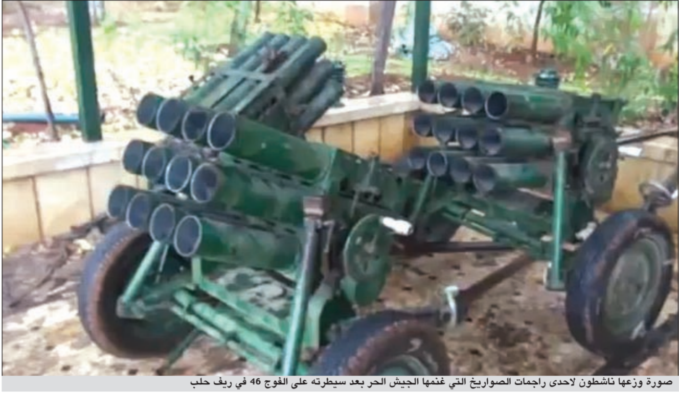
صورة وزعها ناشطون لاحدى راجمات الصواريخ التي غنمها الجيش الحر بعد سيطرته على الفوج 46 في ريف حلب

عواصم - وكالات: صدقت القوات النظامية السورية من الحملة العسكرية التي تنفذها على معقل المعارضة في قرى واحياء في ادلب ودرعا وحلب واللاذقية ودمشق وريفها استخدمت خلالها المدفعية وقذائف الهاون وراجمات الصواريخ وهو ما أدى الى انهيار منازل عدة وحالات نزوح جماعي. في المقابل، قال ناشطون إن عناصر من الجيش السوري الحر استهدفوا مطار المزة العسكري بالقرب من العاصمة السورية دمشق، بقذائف الهاون وشوهدت اعمدة الدخان المتصاعدة من المطار في أرجاء العاصمة، ويعتبر «مطار المزة العسكري» احدى الأزرع العسكرية الفاعلة في طيران جيش النظام ومنه تنطلق معظم الحوامات التي تقتصف دمشق وريفها وفق تأكيدات السكان. من جهة أخرى، قالت شبكة «شام» الاخبارية المعارضة ان القصف العنيف بالمدفعية الثقيلة استمر امس على احياء دمشق الجنوبية وبساتين حي كفر سوسة وسط اشتباكات