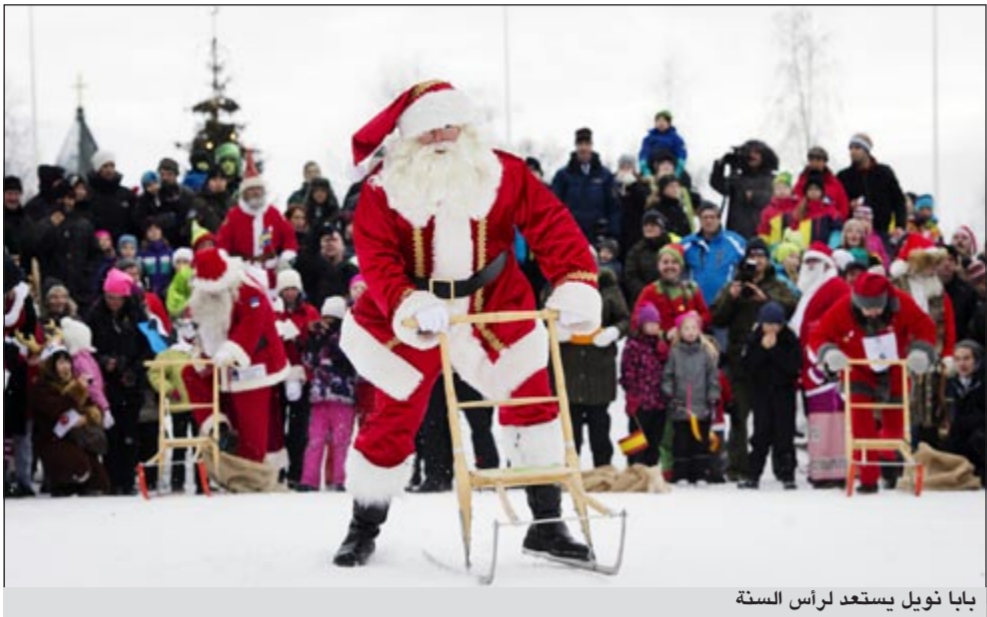
بابا نويل يستعد لرأس السنة