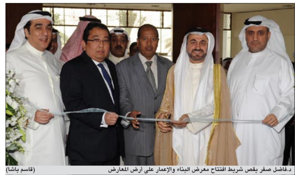
د.فاضل صفر يقص شريط افتتاح معرض البناء والإعمار على أرض المعارض (قاسم باشا)

بمشروع إنجاز الجسر، وأن الترسية جاءت بعد قرار لجنة المناقصات المركزية ووزارة الأشغال العامة. وأوضح صفر أن ملاك الشركة الفائزة التي ستفقد المشروع هم من كوريا الجنوبية والشركة مسجلة في الأسواق العالمية، نافية أي شبهة تتفجع لطرف ما من خلال توقيع العقد. وتابع الوزير قائلاً: «قد يكون وكيل الشركة كويتي كما هي القوانين المعمول بها في البلاد التي تنص على أن يكون الوكيل من أبناء هذا البلد، مشيراً إلى أن الشركة المخالفة مع الشركة الكورية الفائزة، هي شركة وطنية ولا يتصل مجلس إدارتها بأي من أعضاء السلطة التشريعية». وفيما يتعلق بالقرارات التي يتخذها مجلس الوزراء عموماً أكد الوزير صفر أن المجلس متضامن بجميع أعضائه والذين يدافعون عن جميع القرارات التي يصدرها المجلس. وعن قيام ديوان المحاسبة بإعداد