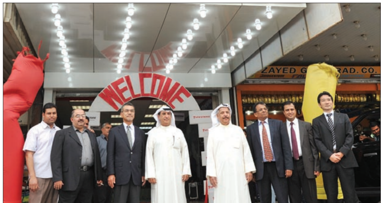
أعضاء الشركة أمام المقر الجديد للفرع (سعود سالم)

افتتحت شركة توزيع إطارات بريجستون، الموزع الحصري والوحيد لمركبات بريجستون وفابريستون المركز الجديد والحديث لصيانة وتوزيع الإطارات، في الكويت فرعها الجديد امس. وقد بدأت شركة توزيع إطارات بريجستون العمل تحت اسم «ستون» منذ تأسيسها سنة 1956 (أي منذ 56 سنة) على تزويد سائقي السيارات في الكويت بأفضل أنواع الإطارات العالية الجودة من شركة بريجستون اليابانية مع رأسمال يبلغ 33 مليار دولار. وتعتزم الشركة توسيع نطاق عمليات التوزيع، وذلك نظراً لزيادة متطلبات العملاء يوماً بعد يوم سعياً للحصول على المنتجات والخدمات الخاصة بالإطارات عالية الجودة في الكويت، حيث حددت الشركة هدفاً رئيسياً لها وهو تزويد السائقين بأحدث المنتجات وأفضلها من