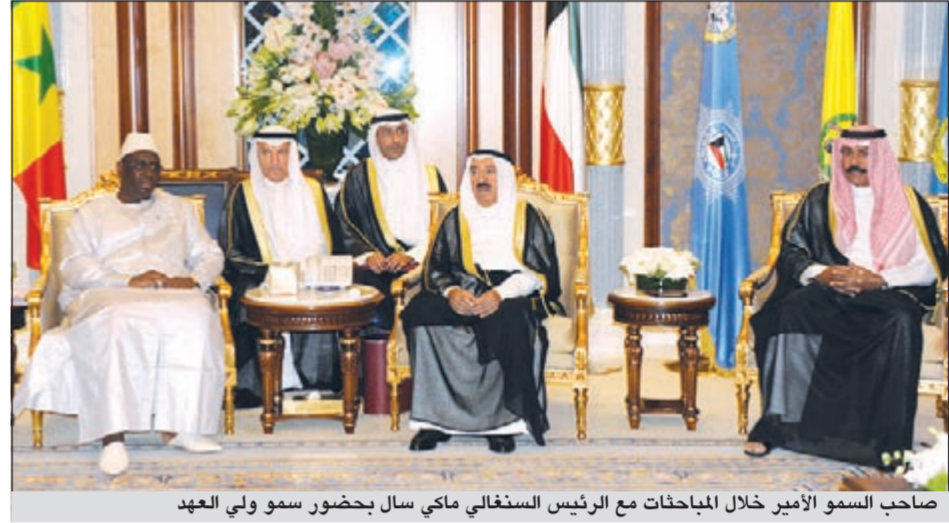
صاحب السمو الأمير خلال المباحثات مع الرئيس السنغالي مكي سال بحضور سمو ولي العهد

استقبل صاحب السمو الأمير الشيخ صباح الأحمد بقصر بيان ظهر أمس وزير الصحة د.علي العبيدي ومدير منظمة الصحة العالمية لإقليم شرق المتوسط د.علاء الدين علوان وذلك بمناسبة زيارته للبلاد.