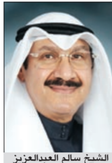
الشيخ سالم عبدالعزيز

محافظ المركزي السابق الشيخ سالم عبدالعزيز يستعرض 15 نصوراً لمعالجة الوضع الاقتصادي والمالي الراهن