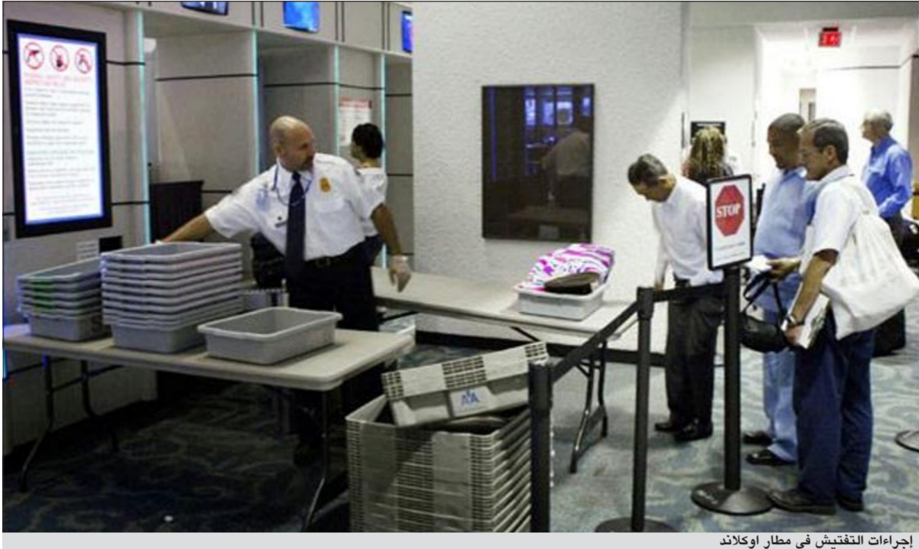
إجراءات التفتيش في مطار أوكلاند