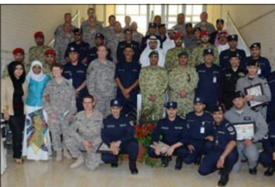
المكرمون يتوسطون عددا من قيادات وأفراد من الداخلية والحرس الوطني