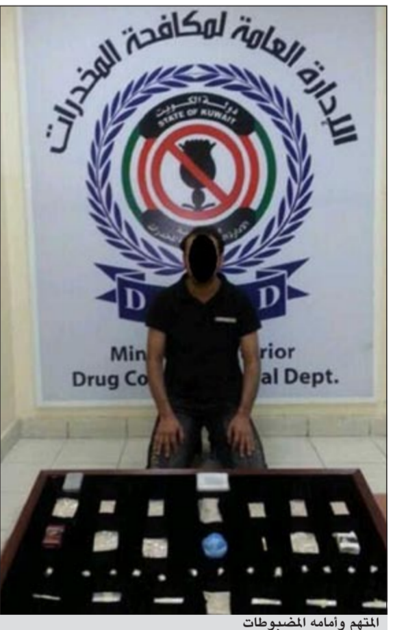
المتهم وامامه المضبوطات

واصل قطاع الأمن الجنائي جهوده في محاربة الجريمة بشني أنواعها وسرعة ضبط تجار ومروجي المخدرات لحماية المجتمع من تلك الآفة الدمرة. وقد تمكن رجال الإدارة العامة لمكافحة المخدرات - إدارة العمليات من إلقاء القبض على وافد آسيوي وبحوزته ربع كيلو هيروين و100 غرام نشبو، حيث وردت معلومات عن ضلوع الآسيوي في الاتجار بالمواد المخدرة وبعد اتخاذ الإجراءات القانونية وما سبقها من تحريات وجمع المعلومات والاستدلال تمت مدهامة مسكنه وتفتيشه وعثر على 25 لفافة تايلون مختلفة الأحجام بداخلها مادة الهيروين، و6 أكياس أخرى بداخلها مادة النشبو، وبسؤاله عن مصدر المخدرات أكد انه جلبها من بلاده عبر تهربها باماكن سرية. هذا وتمت إبلاغه والمضبوطات إلى جهات الاختصاص.