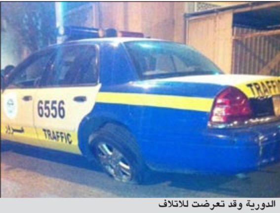
الدورية وقد تعرضت للتلاتف

سجل رجال مرور محافظة الأحمدى قضية إتلاف ضد عدد من المستهترين في مخفر صباح السالم بعد أن قام مجموعة منهم بإتلاف دورية أمن وتحطيمها أمام صالة أحد الأعراس في المنطفة. وبحسب مصدر أمني أن رجال الأمن سيقومون باستدعاء أصحاب 3 سيارات على الأقل شارك أصحابها مع مجموعة من المجهولين بتحطيم دورية مرور كان رجالها قد توجهوا للصالة استجابة لبلاغ إزعاج حول قيام قاندي 3 مركبات بالاستعراض أمام صالة عرس، وأضاف المصدر حال وصول الدورية كان أصحاب السيارات يقومون بالاستعراض وقام رجال الدورية بمحاولة إيقافهم إلا أن المستعرضين ومجموعة من الجمهور قاموا بإلقاء الحجارة على الدورية، كما قام أحد قادة السيارات الثلاث بالإصطدام بالدورية، ما أدى لاتلافها قبل أن يفر قادة السيارات الثلاث والجمهور، وعليه توجه قائد الدورية ومرافقه لمخفر صباح السالم وسجلوا قضية إتلاف عمد ضد المستعرضين الثلاثة وقدموا لرجال أمن المخفر أرقام لوحات السيارات الثلاث.