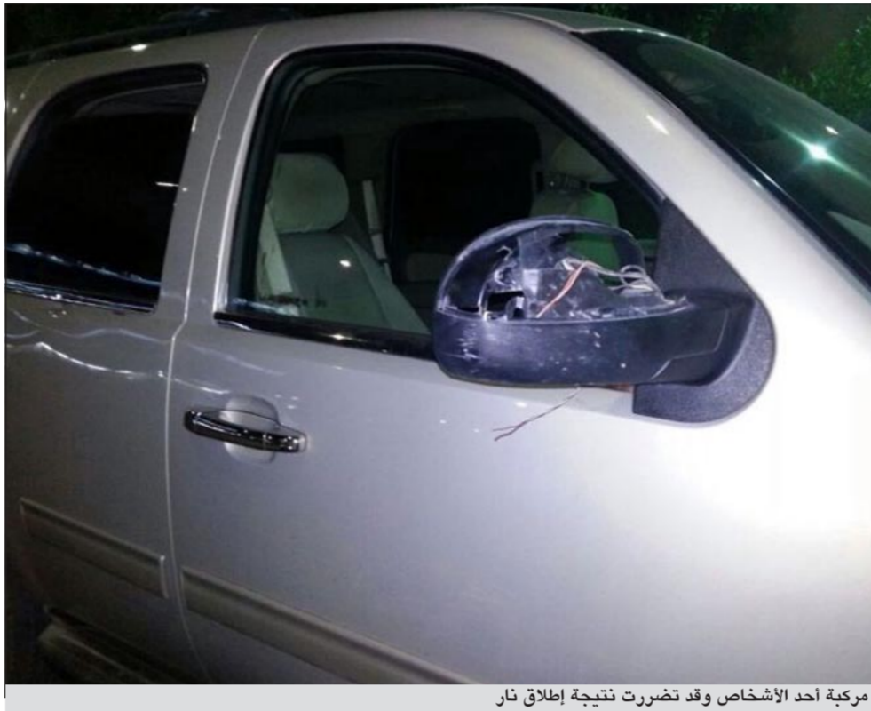
مركبة أحد الأشخاص وقد تضررت نتيجة إطلاق نار