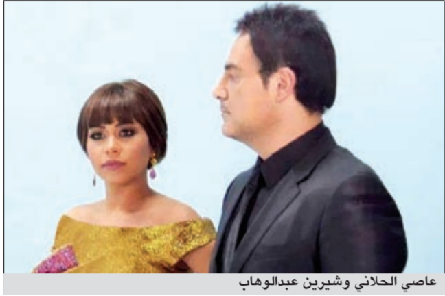
عاصي الحلاني وشيرين عبد الوهاب