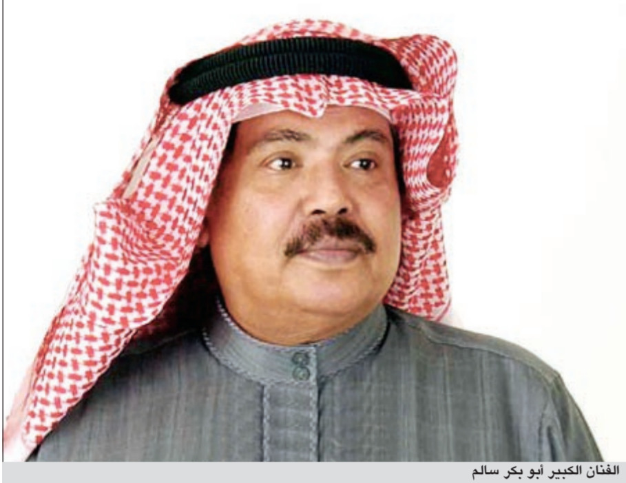
الفنان الكبير أبو بكر سالم

دون التيقن من ذلك أو مراعاة مشاعر الفنان أو أسرته وجمهوره. وتابع أصيل: «حسبي الله ونعم الوكيل في كل من يبشر أخبارا كاذبة عن والدي، الذي يتواجد حاليا في الرياض بمنزل العائلة وليس بالمستشفى كما أشيع، وسوف يذهب لإجراء بعض الفحوصات الطبية في ألمانيا خلال شهرين من الآن».