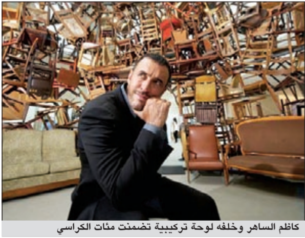
كاظم الساهر وخلفه لوحة تركيبية تضمنت مئات الكراسي

سواء بلامح وجهه الطريفة أو حركة يده وكأنه جزء من اللوحة.