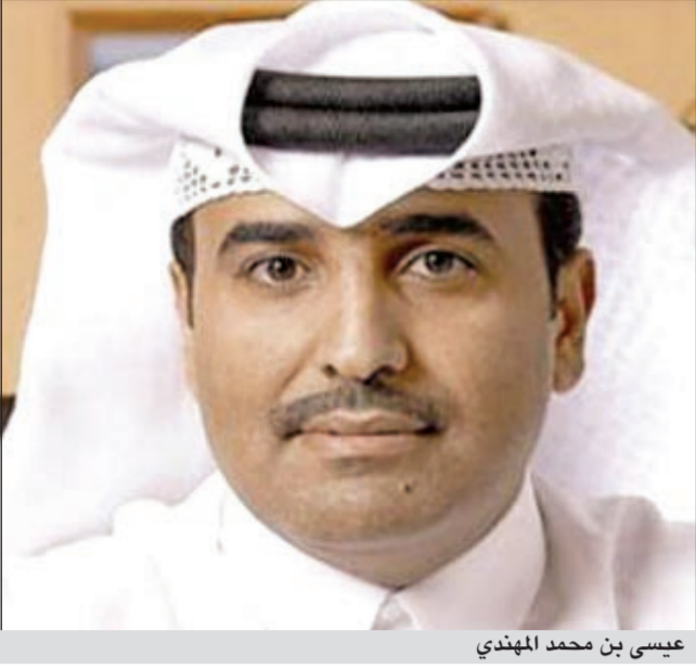
عيسى بن محمد المهدي