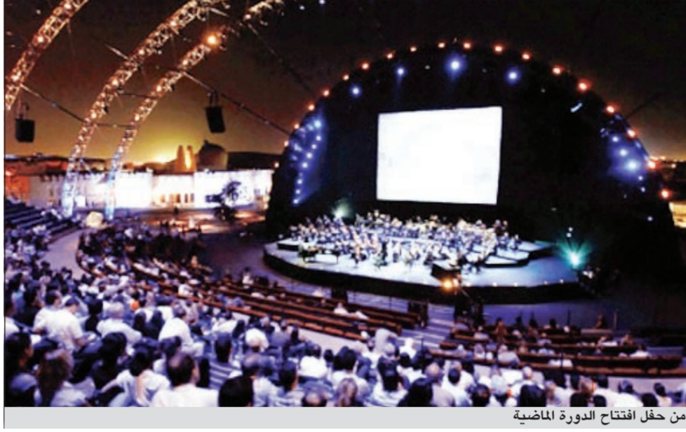
من حفل افتتاح الدورة الماضية