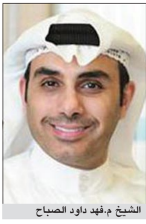
الشيخ م.فهد داود الصباح

وأضاف الصباح «إن الحق الممنوح للفرد يعني أن يكون الترخيص للفرد ذاته بمعنى أن الذي يرغب بتنظيم مسيرة عليهم أن يقدموا الطلب بأسمائهم جميعاً، أي أن يوقع من يريد السير في المسيرة على هذا الطلب ولا اعتبر الطلب مخالفاً للدستور وإذا وافق عليه المحافظ أو الوزير رغم أنطوائه على عيب دستوري واضح يكون المحافظ أو الوزير قد خالف الدستور، وهنا يجب عليه التخلي عن منصبه أو وجب على السلطة الأعلى منه إحالته إلى المحكمة أو محكمة الوزراء، لأن مخالفة لا تقف عند حدود هذه السلطة الذي يجب ألا يكون من يشغل منصباً مرموقاً في الدولة جاهلاً به، كما أنه يكون مخالفاً لقانون الجزاء، لأنه ساعد على ارتكاب مخالفة للقانون، أي