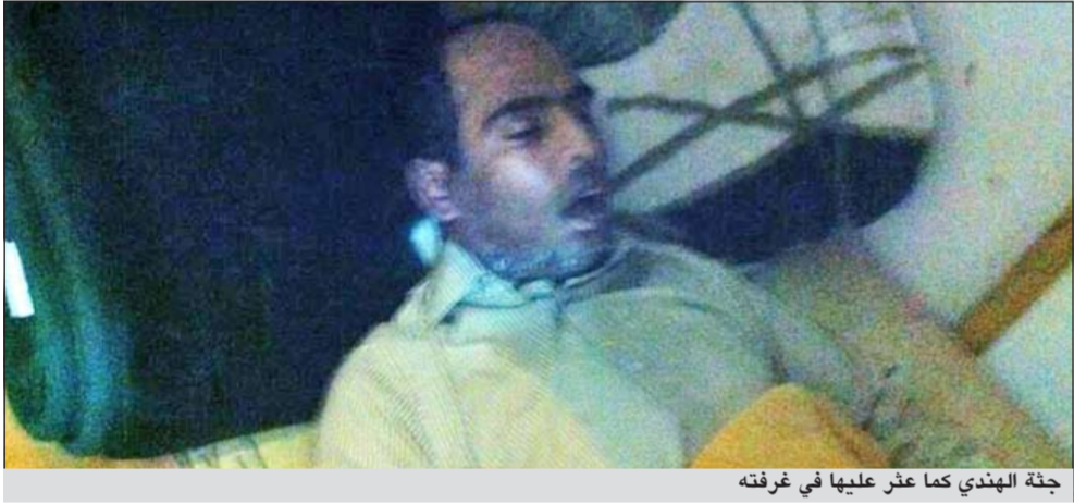
جثة هندي كما عثر عليها في غرفته

انتظرت يومين حتى يعود لكنني وبعد ان ازدادت حدة الراحة قمت بكسر الباب بعد الاستئذان من صاحب النجاة ووجدت جثة الوافد الهندي على سريريه وقمت بالاتصال على العمليات.