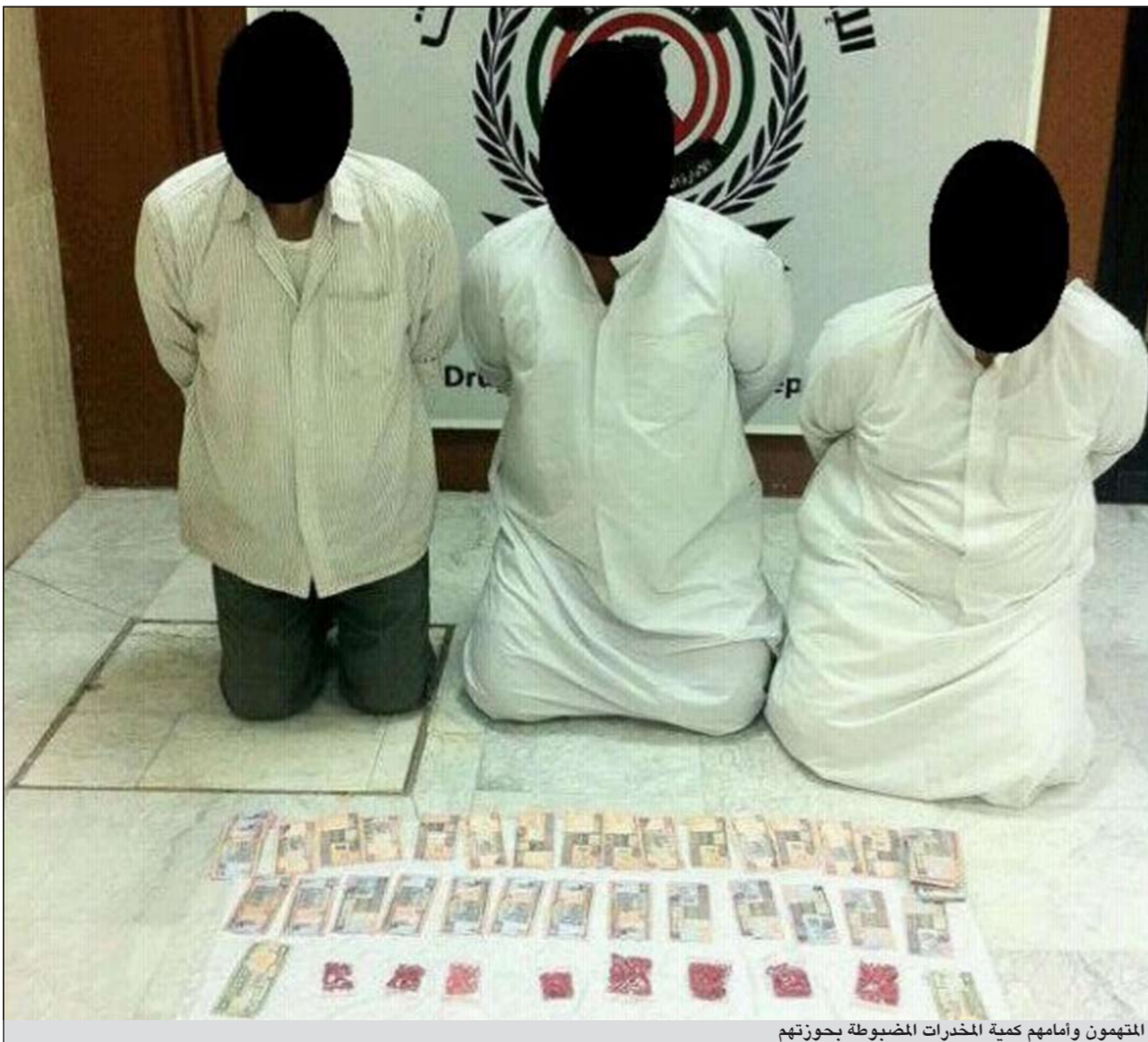
المتهمون وامامهم كمية المخدرات المضبوطة بحوزتهم

قادت الصدفة رجال ادارة المهام السرية التابعة للأمن العام لضبط 3 أشخاص بحالة غير طبيعية وبحوزتهم قطعان من الخشيش و40 غراماً من الهيروين معدة للبيع وعدد