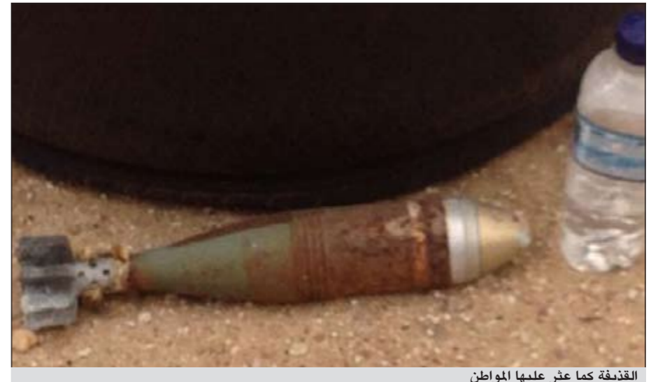
القذيفة كما عثر عليها المواطن

استنفر رجال ادارة المتفجرات امس بعد ورود اتصال من مواطن لعملية داخلية يبلغ فيها عن عثوره على قذيفة قرب مخيمه. وقال مصدر أمني انه خلال اقل من ساعة حضر