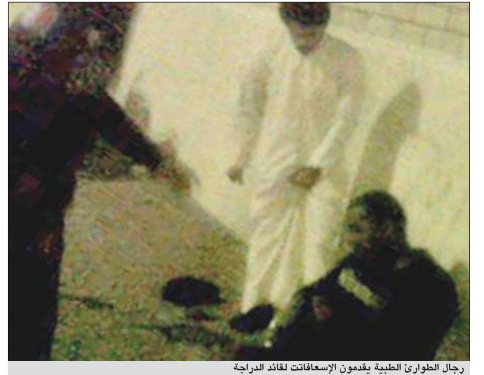
رجال الطوارئ الطبية يقدمون الإسعافات لقائد الدراجة

نقل مواطن في الـ 18 من عمره الى مستشفى الجبراء بعد إصابته بكسر في ساقه والتواء في عنقه إثر اصطدام الدراجة النارية التي كان يقودها بسور مدرسة، وفي التفاصيل كما يوردها مصدر أمني ان بلاغاً الى غرفة العمليات مساء اول من امس عن حادث اصطدام سيكل. وفور حضور رجال الأمن تبين ان سائق الدراجة ملقى على الأرض وتمكن من شرح ظروف الحادثة لهم قائلاً: انحرفت بي الدراجة