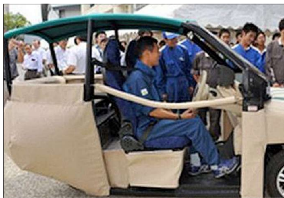
السيارة ذات الوسادة الهوائية

ويمكنها أن يقطع مسافة 30 كم، وصممت السيارة من مواد خفيفة ويبدو من مظهرها الخارجي وكأنها وسادة أريكة. ويؤكد الخبراء أن مثل هذه السيارة تقلل احتمال تعرض المشاة للاصابة في احدى حد ممكن، كما تمنع هذه التقنية إلحاق أي ضرر بالسيارة في مثل تلك الحالات. وبحسب الابتكار الجديد