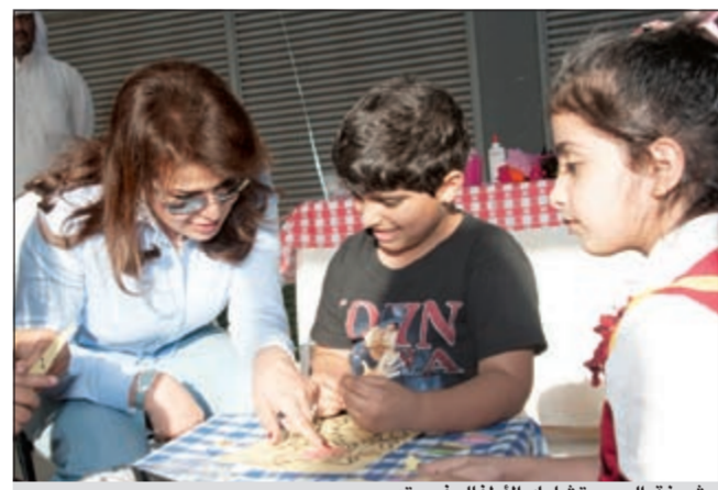
شبيخة البحر تشارك الأطفال فرحتهم

وأشارت البحر بقولها: «هناك حكايات ونكريات تتناقلها الأجيال لعلاقة البنك الوطني مع الأطفال، وليس غريباً اليوم أن يستمر البنك مرتبطاً بذكرة الكبار لا بل ان يستمر هذا الترابط وينتقل من جيل إلى آخر. كما أننا نفخر اليوم بأن يكون البنك الوطني أحد أكبر المساهمين في تنمية المجتمع الكويتي، وتحديدًا من خلال مبادراتنا تجاه مرضى السرطان». وقد تخلل المهرجان العديد من الأنشطة والبرامج الترفيهية الخاصة بالأطفال الذين شاركوا في العروض المسلية وأيضاً وقتاً ممتعاً برفقة شخصياتهم المحيية مثل جومل، وتفاعلاً مع الاستعراضات الحية بسعادة بالغة، كما قدمت أسرة البنك الوطني خلال هذا المهرجان الهدايا لهم.