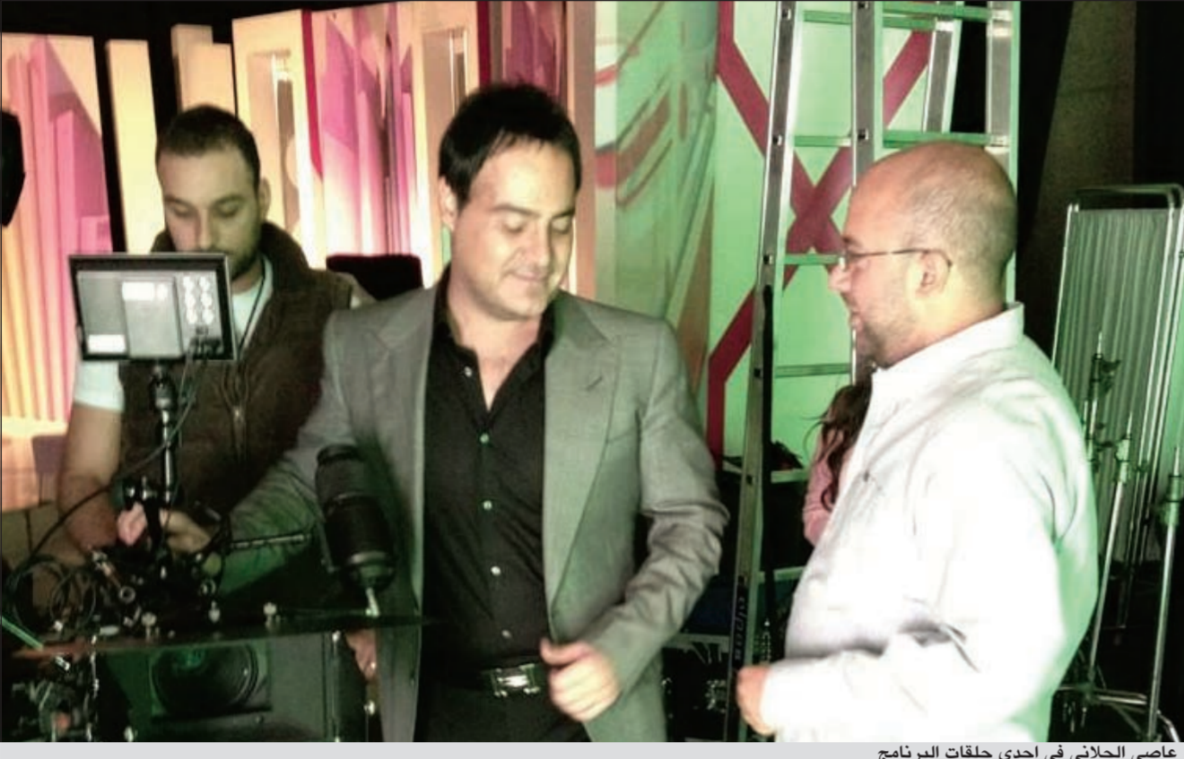
عاصي الحلاني في إحدى حلقات البرنامج

سيقف النجوم إما أمام مجلس لعمالقة الفن أمثال عبد الحليم حافظ، شادية، فريد الأطرش، أم كلثوم وغيرهم وسيغنون معه ديو، أو سيتم إدخالهم في مشاهد من الأفلام المصرية القديمة التي غنى فيها عمالقة الطرب. هذا، وواجه تنفيذ البرنامج صعوبة خاصة كونه يحتاج إلى تقنيات عالية خاصة رغم أن تكلفته معتدلة، وستتم استحضار فناني كبار، للغناء مع أحد نجوم اليوم، خصوصا أن فكرة البرنامج تقوم على جمع المغنين الشباب العرب مع الفنانين العرب الراحلين أمثال محمد عبد الوهاب، وفريد الأطرش، وعبد الحليم حافظ، وأم كلثوم، وأسماهان، وطلال المداح من خلال لعبة مونتاغ.