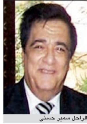
الراحل سمير حسني

غيب الموت امس الاول الفنان المصري سمير حسني بعد فترة طويلة من المرض قضاها داخل العناية المركزة بعدة مستشفيات مختلفة. سمير حسني لم يظهر منذ فترة طويلة على شاشة التلفزيون بسبب حالته الصحية ومنها تعرضه لجلطة بالبحر العام الماضي. يذكر أن آخر أعمال حسني مشاركته في مسرحية سيرة الحبيب على مسرح البالون ومسرحية والله زمان 2010 ومن قبلها مسرحية مئين اجيب ناس عام 2008 ومن شهر مسرحياته على الاطلاق استاذ مزبكا وشارك فيها سمير غانم.