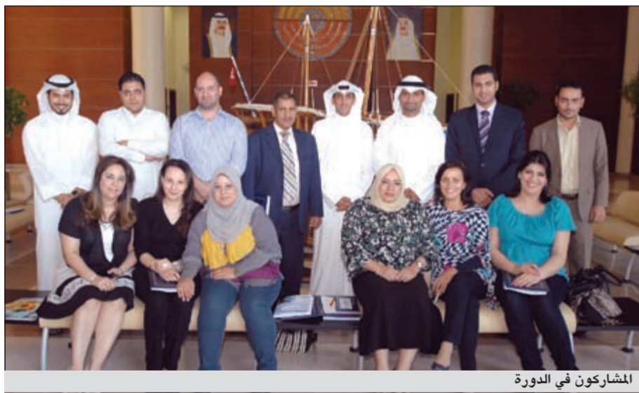
المشاركين في الدورة