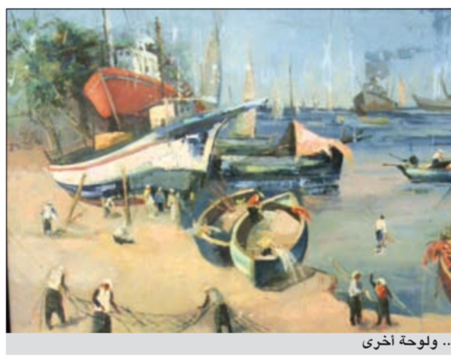
.. ولوحة أخرى