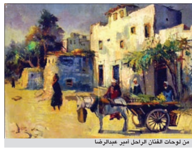
من لوحات الفنان الراحل أمير عبدالرضا

أقيم معرض الفنان الراحل أمير عبدالرضا بعنوان «لمسة وفاء» في مقر الجمعية الكويتية للفنون التشكيلية بمناسبة مرور 20 عاماً على وفاته بحضور الفنان عبدالرحمن عبدالرضا وحضور فني غفير. وأعلن عبدالرسول سلمان عن قيام مجلس ادارة الجمعية بتسمية إحدى قاعاتها باسم الفنان الراحل أمير عبدالرضا لدوره الكبير في تطوير الفن التشكيلي وعطاءه في مجالات الفن.