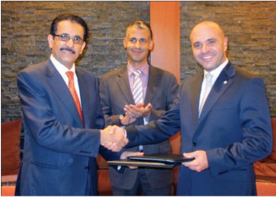
جانب من توقيع العقد

من خلال تطويرها علامة «ريحان للفنادق والمنتجات» الخالصة من الكحول والتي أُنشئت نجاحها في المنطقة بعد العديد من الافتتاحات في المملكة العربية السعودية ودولة الإمارات العربية المتحدة. تجدر الإشارة إلى أن الفندق الجديد المزمع إنشاؤه يقع على الواجهة البحرية الجنوبية من مشروع رباط البحر في العاصمة الموريتانية نواكشوط، ويتضمن أكثر من 230 غرفة، ومطاعم راقية ومتخصصة، وقاعات اجتماعات ومساح وناديا صحيا، بالإضافة إلى جميع أنواع الخدمات الأخرى المتوفرة في فنادق الخمس نجوم وفقا للمعايير العالمية. ومن المتوقع أن يتم افتتاح الفندق نهاية العام 2014 وقد قام الجهازان الفنيان لكل من روتانا والمجموعة الموريتانية بخطوات متقدمة على صعيد التصميم خلال الأشهر الماضية لتسريع التنفيذ. وحتم الوزير قائلا: «منذ نشأتها، تطورت روتانا لتصبح الشركة الرائدة إقليميا وعلامة تجارية استطاعت حوز احترام واعجاب الجميع، وذلك بفضل فريق العمل ممن يمتلكون خبرات علمية وفهما عميقا للتلفقات المحلية في الشرق الأوسط وأفريقيا». وأضاف الوزير «يستند النمو المذهل في عدد الفنادق والمنتجات التي تديرها روتانا إلى مبدأ انجاز الأمور بطريقة صحيحة في المرة الأولى وفي كل مرة، سعيا لتحقيق خطتنا الاستراتيجية الرامية إلى إدارة فندق واحد على الأقل في كل دولة بالمنطقة».