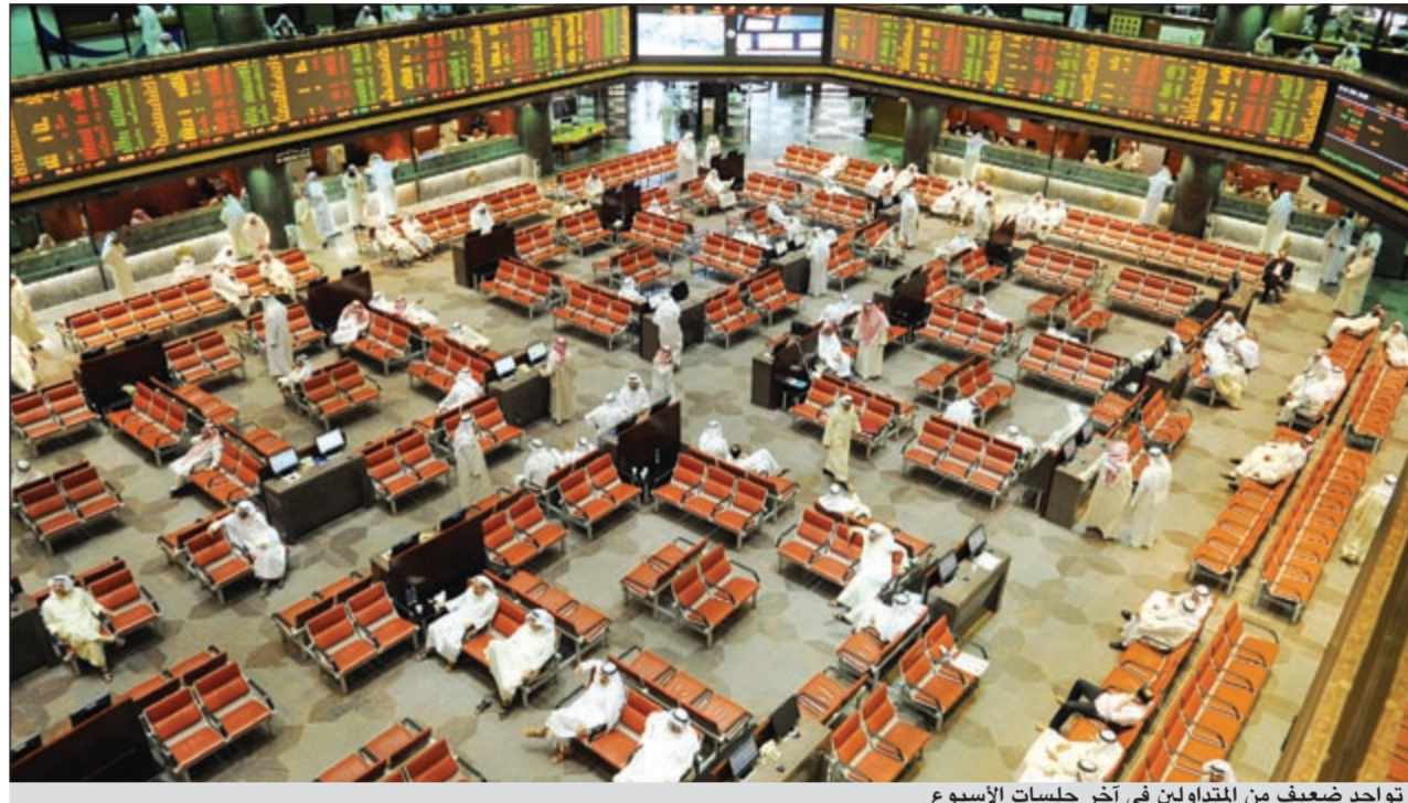
تواجد ضعيف من المتداولين في آخر جلسات الاسبوع

انتهى سوق الكويت للأوراق المالية تعاملات الاسبوع على استمرار حالة التباين في أداء مؤشرات، ولكن مع اختلاف في حركة هذه المؤشرات، حيث تراجع المؤشر السعري بمقدار 15,3 نقطة ولكنه حافظ على استقراره فوق مستوى 5800 نقطة الذي بلغه في جلسة تعاملات أول من أمس، وتراجع أيضا المؤشر الوزني بقدر محدود بعد ارتفاعات أيضا محدودة على مدار الجلسات الثلاثة الأخيرة ليحافظ على استقراره فوق مستوى 409,5 نقاط، أما مؤشر كويت 15 فشهد تحولا في أدائه، حيث ارتفع بأكثر من 3 نقاط بعد تراجع على مدار أكثر من جلسة، وجاء هذا التحسن في الأداء لهذا المؤشر جراء ارتفاع بعض الأسهم التي تدخل ضمن مكوناته وخاصة الأسهم البنكية مثل الخليج والمتحد وبيبان. وتأثرت جلسة تعاملات أمس بمخاوف كثير من المتعاملين بإيقاف عدد من الشركات مع بداية تعاملات الاسبوع المقبل خاصة أن جلسة أمس كانت الأخيرة في هالة الكشف عن النتائج، وهناك الكثير من الشركات التي لم تفصح عن بياناتها المالية وابتغت عرضة للإيقاف وهو ما دفع شريحة كبيرة من المتعاملين للتخارج من هذه الأسهم، الأمر الذي أدى إلى تنديب واضح على مستوى أداء مؤشرات السوق وخاصة السعري الذي بدأ على ارتفاع محدود ولكن سرعان ما اتجه للانخفاض بسبب التوسع في العمليات البيعية التي أدت إلى انخفاض المؤشر العام لأكثر من 30 نقطة ليتراجع خلال التعاملات إلى 5785 نقطة، كما أن هناك عملا آخر عزز من توجه السوق البيعي وهو جني الأرباح من الأسهم التي شهدت ارتفاعات ملحوظة على المستوى السعري خلال الجلسات الأخيرة والتي كان السوق يحقق فيها مكاسب متواصلة.