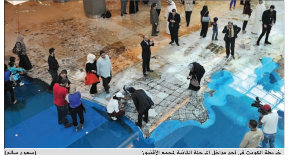
خريطة الكويت في أحد مداخل المرحلة الثانية لمجمع الأقيونوز (سعود سالم)