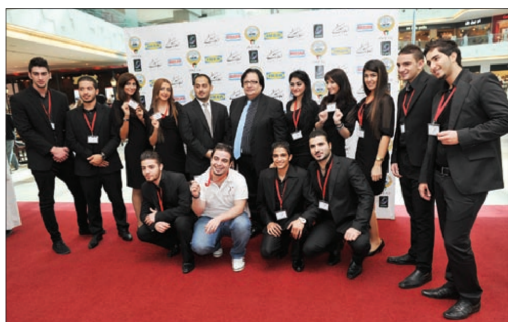
مجموعة من فريق العمل