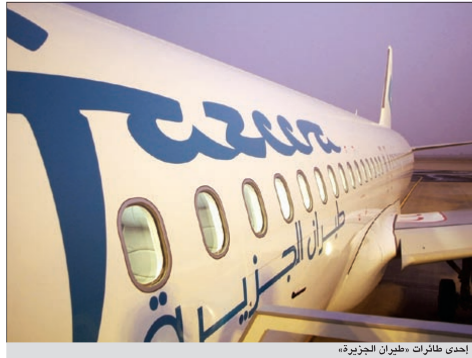
إحدى طائرات «طيران الجزيرة»

أظهر تقرير الأداء التشغيلي لشركة طيران الجزيرة عن شهر سبتمبر 2012، أن الشركة واصلت الاستحواذ على حصص تشغيلية قيادية على الخطوط التي تخدم الجهات الأكثر طلباً من الكويت منها بيروت والقاهرة واسطنبول وشم الشيخ. كما واصلت «طيران الجزيرة» الاستحواذ على حصص قيادية على الخطوط الأكثر طلباً من الكويت، إضافة إلى تحقيقها من جديد أعلى نسبة التزام بمواعيد السفر مقارنة بالشركات الأخرى في الشرق الأوسط، وذلك بحسب تقرير المركز الأميركي المستقل لتعقب ومراقبة الرحلات (فلايت ستاتس) حيث بلغت نسبة التزام «طيران الجزيرة» بمواعيد السفر 96٪ خلال شهر سبتمبر لتكون الأكثر التزاماً بمواعيد السفر في المنطقة للشهر الحادي والعشرين على التوالي.