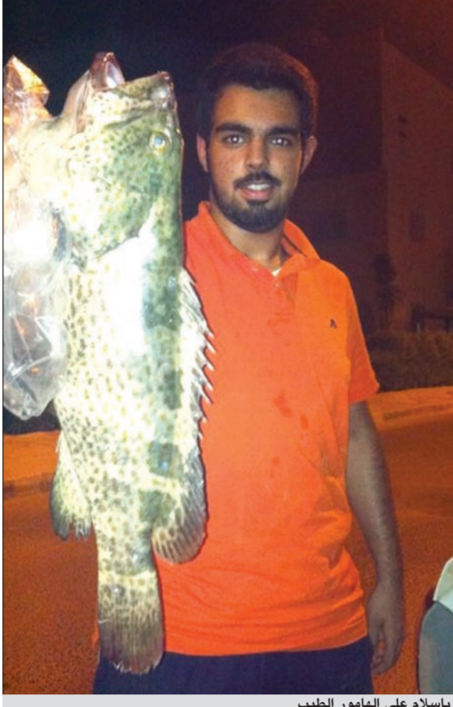
ياسلام على الهامور الطيب