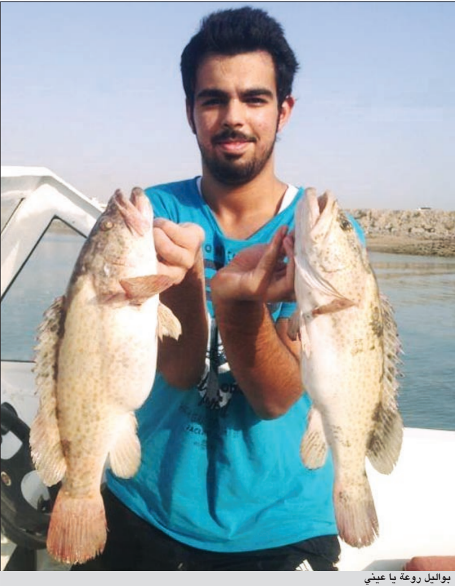
بواليل روعة يا عيني