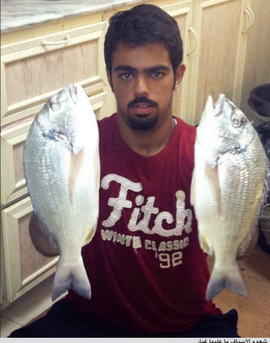
شعوم الاسياف ما عليها غبار