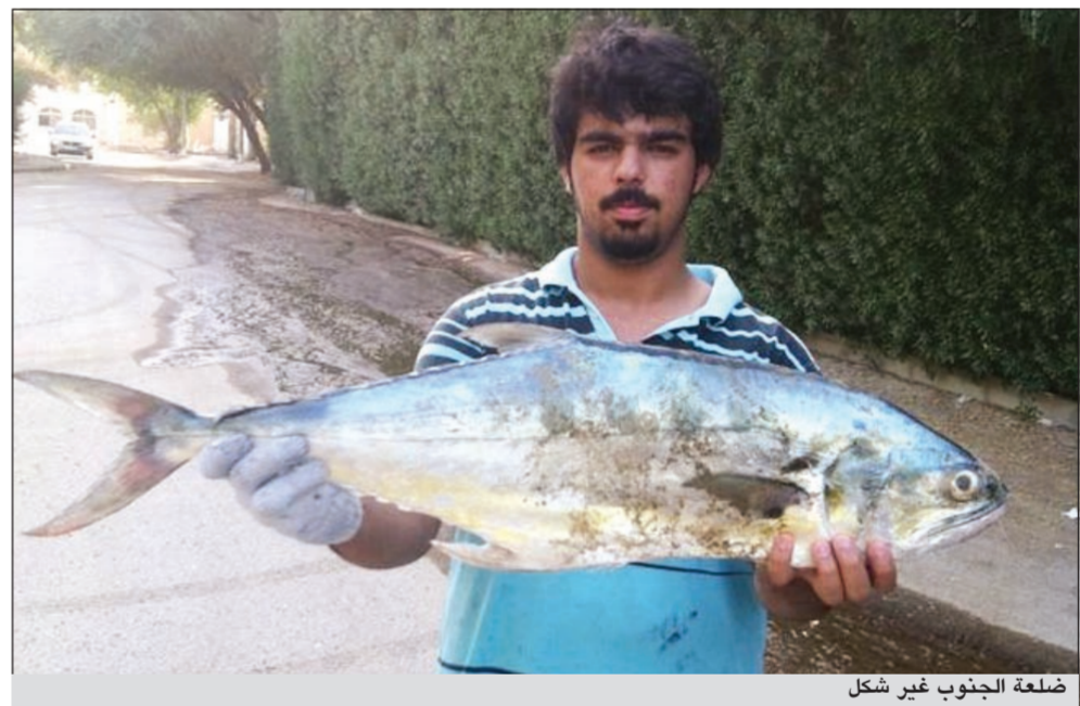
ضلعة الجنوب غير شكل

كلمة ختامية: احب ان اختم بكلمات بسيطة وادعو من خلالها لاخواني الحداقة بالصيد والسلامة، كما ارجو من المسؤولين الاهتمام بالبحر والسنتات وفي الختام عسى كل واحد يدخل البحر ان يرجع بادامه.