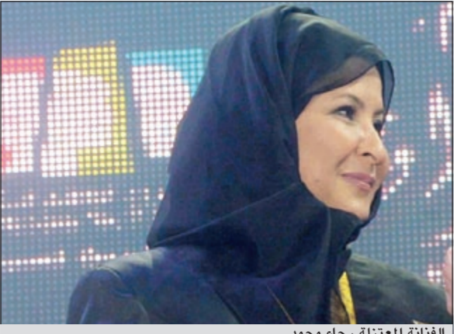
الفنانة المعتزلة رجاء محمد