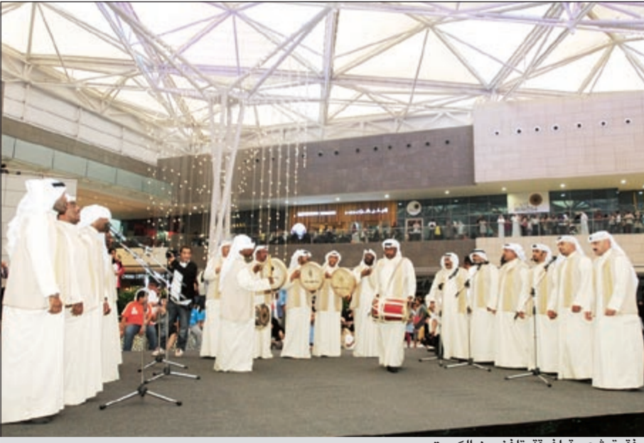
فرقة شعبية لفرقة تلفزيون الكويت

والبهجة. وانتقلت أجواء الاحتفالية بعد ذلك إلى ساحة المطاعم داخل منطقة «غراند أفنيو»، حيث قدمت فرقة تلفزيون الكويت أروع فقراتهم الشعبية والفلكلورية التي حازت إعجاب جميع الحضور من عشاق الأغاني التراثية القديمة. وفي السياق ذاته، نظمت إدارة التسويق والعلاقات العامة جولة للمناطق الجديدة في «الأقنيوز»، التي سيتم افتتاحها تباعاً للمدنيين وأصحاب مواقع التواصل الاجتماعي، حيث اطلع الحضور على آخر مستجدات المناطق الجديدة. وتأتي هذه الزيارة حرصاً من إدارة «الأقنيوز» على تعزيز التواصل المستمر مع المدنيين وأصحاب المواقع الاجتماعية بهدف إطلاعهم على كل ما هو جديد.