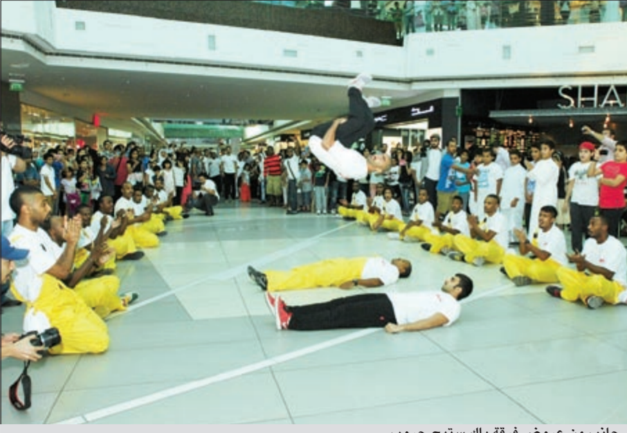
جانب من عروض فرقة باك ستيج جروب

باتت ضحكة عاصي الحلبي على سقطة شيرين عبد الوهاب في برنامج «ذا فويس» مثار نقاش وجدل طويلين، ما أدى إلى نشوب حرب «فيسبوكية» بين عشاق عاصي ومحبي شيرين. ونهالت التعليقات على صفحة «الفانز» الخاصة بـ «فارس الأغنية اللبنانية»، فدافع كثيرون عن الضحكة وكتبوا إحدى العجبات: «مش عيب أن يضحك، أصلاً الموقف يضحك أي واحد..» وقال آخر، بحسب ما ذكر موقع «انا زهرة»: «طبعاً كانت ضحكة مش مقصودة من الفارس عاصي، وكل الناس ضحكوا حتى الـ 100 مليون مشاهد ضحكوا كلهم أكيد..» بينما اعتبر أحدهم أن الموضوع