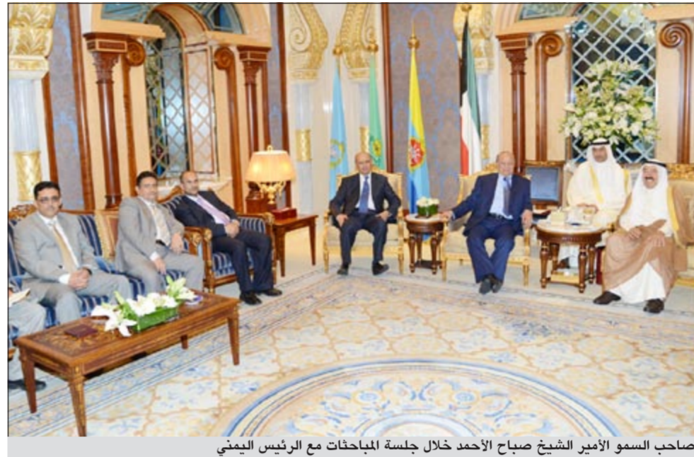
صاحب السمو الأمير الشيخ صباح الأحمد خلال جلسة المباحثات مع الرئيس اليمني

الأصعدة. كما أقام صاحب السمو الأمير الشيخ صباح الأحمد بقصر بيان ظهر أمس مائدة غداء على شرف أخيه الرئيس عبدربه منصور هادي رئيس الجمهورية اليمنية والوفد الرسمي المرافق له وذلك بمناسبة