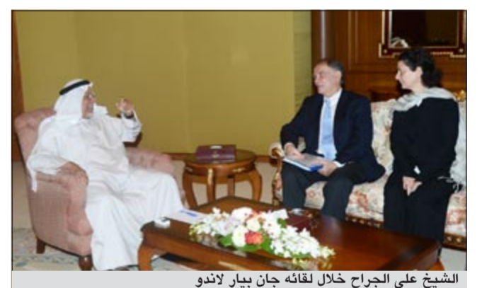
الشيخ علي الجراح خلال لقائه جان بيار لاندو

استقبل نائب وزير شؤون الديوان الأميري الشيخ علي الجراح في مكتبه بقصر بيان صباح أمس جان بيار لاندو مبعوث رئيس الجمهورية الفرنسية الأسبق جاك شيراك وذلك بمناسبة زيارته للبلاد.