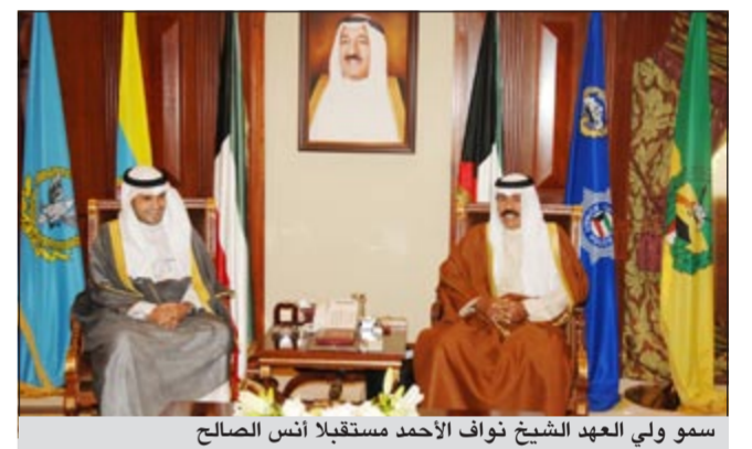
سمو ولي العهد الشيخ نواف الأحمد مستقبلاً أنس الصالح

استقبل سمو ولي العهد الشيخ نواف الأحمد بقصر بيان صباح أمس النائب الأول لرئيس مجلس الوزراء ووزير الداخلية الشيخ أحمد الحمود، ونائب رئيس مجلس الوزراء ووزير الخارجية الشيخ صباح الخالد. واستقبل سموه بقصر بيان صباح أمس وزير التجارة والصناعة ووزير الدولة لشؤون الإسكان أنس الصالح. كما استقبل سمو ولي العهد بقصر بيان أمس رئيس جهاز الأمن الوطني الشيخ محمد الخالد.