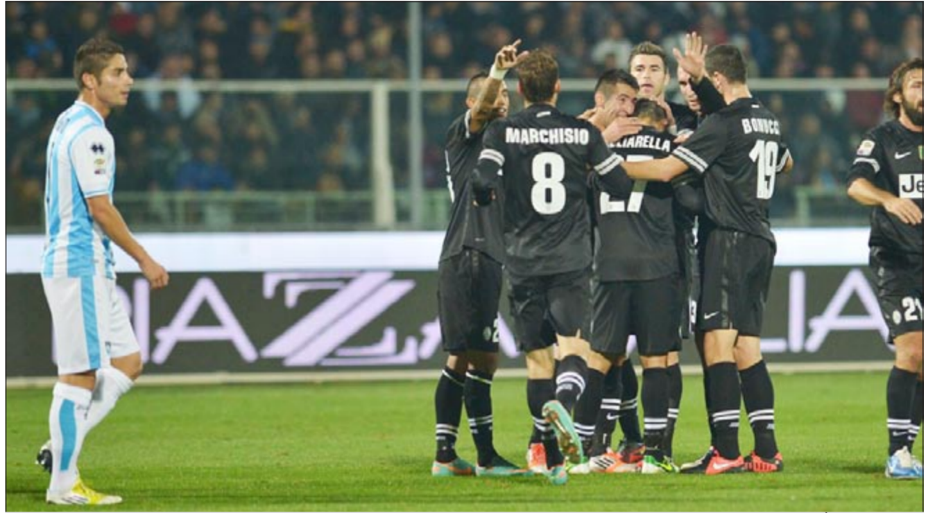
فرحة لاعبي يوفنتوس بالفوز على بيسكارا بسداسية ثقيلة

«السيدة العجوز» تستعيد شبابها .. وباليرمو يقهر سمبوريا.. وتعادل بلد الوليد وفالنسيا