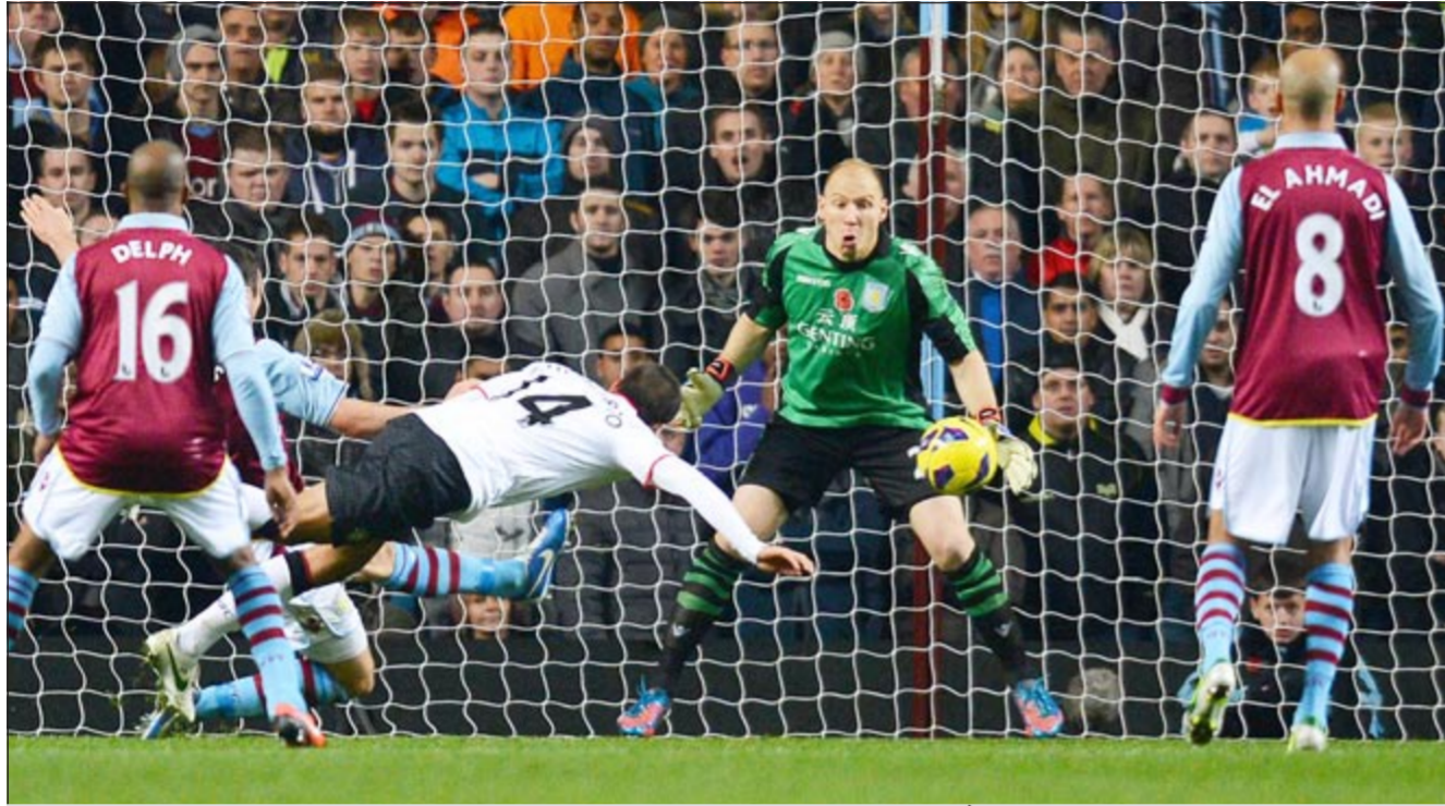
راسية «تشيتشاريتو» في طريقها لهنز شبك استون فيلدا ليفوز مان يونايتد بالمباراة

أثار رحيم سترلينغ، أحد المتضمنين إلى صفوف المنتخب الإنجليزي، المزيد من التساؤلات حول مستقبله مع نادي ليفربول بعد أن حذف تفريده من حسابه بموقع التواصل الاجتماعي «تويتر» كانت تفيد بأنه مستمر مع الفريق، وفي حالة مشاركة سترلينغ (17 عاما) مع المنتخب الإنجليزي في مباراته الودية المقررة أمام نظيره السويدي يوم الأربعاء المقبل، سيصبح ثالث أصغر لاعب يشارك مع المنتخب الإنجليزي خلال 100 عام، وكان سترلينغ قد كتب في حسابه بموقع «تويتر» أنه سيوقع عقدا جديدا مع ليفربول يوم الاحتفال بعيد ميلاده الثامن عشر في الشهر المقبل، ولكنه حذف تلك التغريدة بعدها ليثير الشكوك حول بقائه مع الفريق المنافس في الدوري الإنجليزي الممتاز.