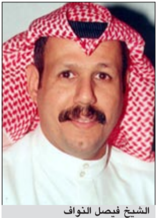
الشيخ فيصل النواف

أكد مدير عام الإدارة العامة للجنسية ووثائق السفر اللواء الشيخ فيصل النواف ان بعض المواطنين لم يتقدموا بطلب استخراج بدل فاقد لشهادة الجنسية، منذ بدء العمل بالدستور، كان دعاة الانتخابات البرلمانية السابقة، مما يتسبب عيباً عليهم وعلى الإدارة العامة للجنسية ووثائق السفر. ودعا جميع المواطنين الذين يحق لهم التصويت في الانتخابات البرلمانية المقبلة والمزمع إجراؤها في 2012/12/1 المقبل الى ضرورة التأكيد من وجود شهادة الجنسية الكويتية الأصلية بحوزتهم، مشيراً الى ان من قدمها عليه التقدم لإدارة العامة للجنسية ووثائق السفر للقيام بإجراءات استخراج بدل فاقد لشهادة الجنسية.