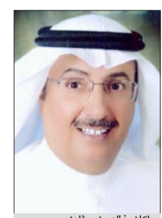
راكان خالد بن حثلين

الكويت الى سابق عهدنا وأن تبقى واحة أمان، مشنداً على أن المرحلة المقبلة يجب أن تتسم بالهدوء واستخدام لغة الحوار الراقية التي لا تخضع الى التهديد أو التلويح أو التخوين أو الحافة في الولوات. وأكد أن الوحدة الوطنية هي أساس استمرار وبقاء الكويت ولابد من المحافظة عليها وصيانتها، مطالباً الحكومة بسرعة إقرار وتنفيذ قانون وبقاء الكويت ولابد من المحافظة عليها وصيانتها، مطالباً الحكومة بسرعة إقرار وتنفيذ قانون