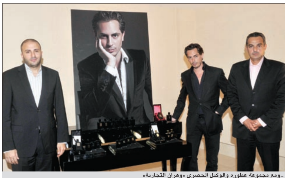
..ومجموعة عطوره والوكيل الحصري «وهران التجارية»

ترن أصداؤها.. وصورة «دوربان غراي» المعلقة أمامه على الخائط تسيطر عليه تماما كما أصبحت أصوات «بيودا» مصدر النور والوحي للمغني سنوب دوغ. واستشهد بقول بولدين: «تسافر روحي على نفحات العطر كما تسافر الروح على أنغام الموسيقى». فإن إبداعات كيليان هي أنغام لكل روح تنوق للسفر والترحال.