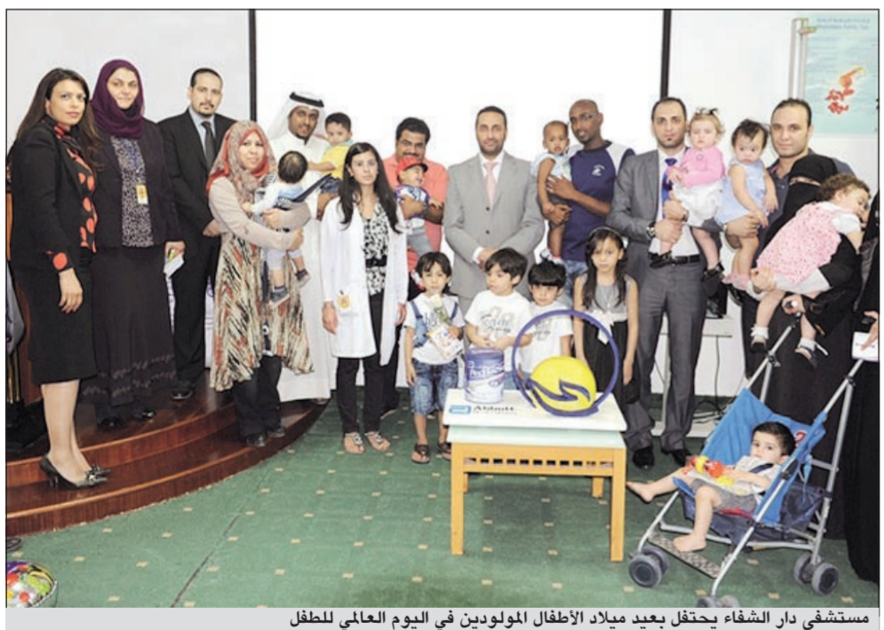
مستشفى دار الشفاء يحتفل بعيد ميلاد الأطفال المولودين في اليوم العالمي للطفل

خدمات الرعاية الصحية عالية الجودة للأطفال، ويحتوي القسم على مجموعة من الوحدات الطبية التي تشمل وحدة الرعاية المركزة للأطفال الخدج ووحدة الولادة ووحدة طوارئ الأطفال، بالإضافة إلى عيادات الأطفال العامة، يضم قسم الأطفال عيادات تخصصية نادرة كعيادة أمراض الجهاز الهضمي للأطفال، عيادة أمراض القلب عند الأطفال وعيادة روماتيزم الأطفال، ولقد تم مؤخرا افتتاح عيادة التطعيمات في قسم الأطفال حيث توفر أنواعا من التطعيمات جاري الماء وتطعيم روتا.