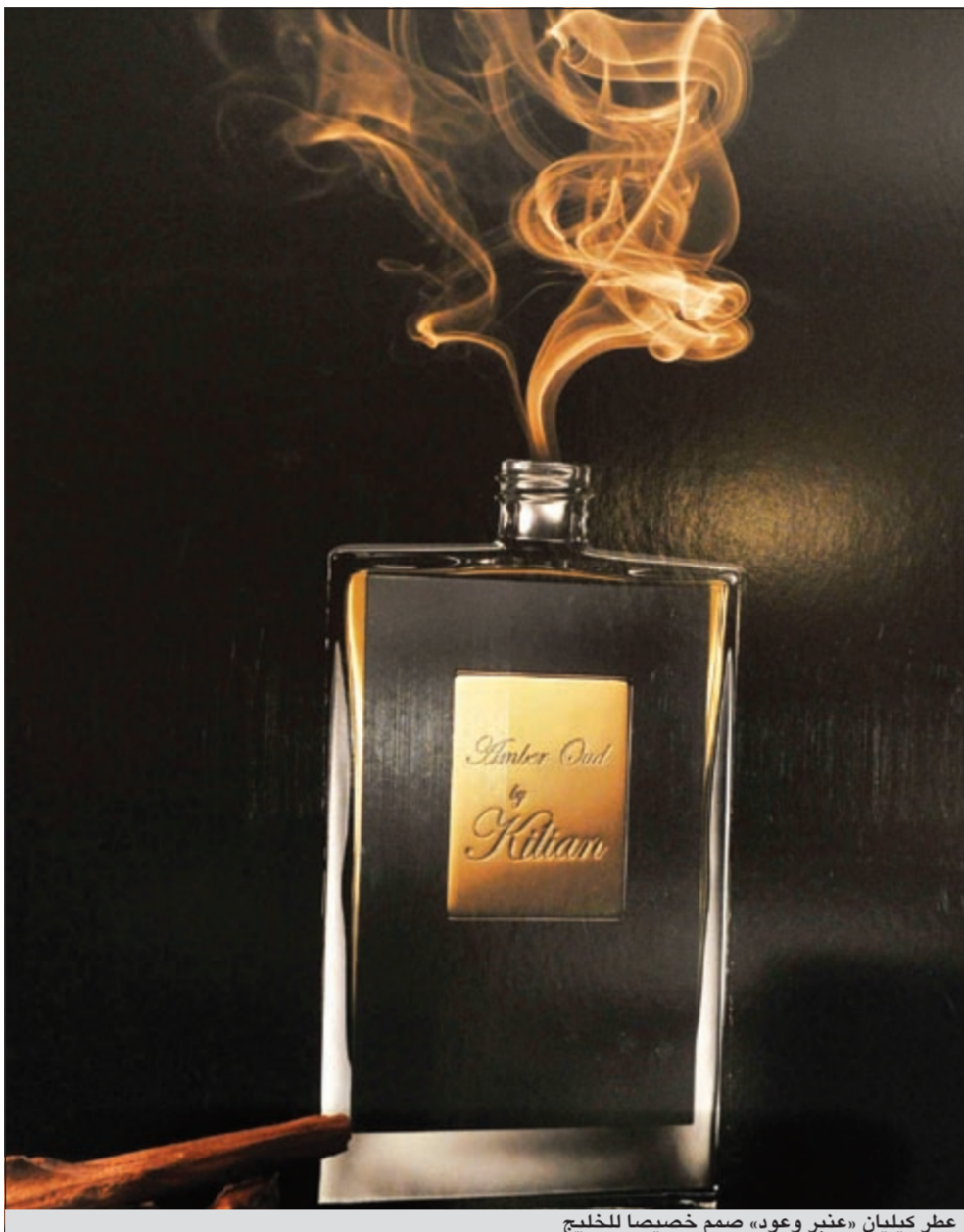
عطر كيليان «عنبر وعود» صمم خصيصا للخليج

كانت مصدر إلهام الشعراء.. يفتتح هذا العطر سنفونيته بأريج الورد ثم تصدر عنه أنغام باقة من الورد التركي، وتتبعها النفحات الخشبية للباتشيولي وطحلب الأوكموس والسنديان الممزوجة بعنبر المسك المنير. التناقض المذهل لحواس الشم الذي يمزج بين النضارة والانتعاش لزهره الخزامي ودفي فانيلا البوربون. وهو من تصميم: كاليب بيكر.