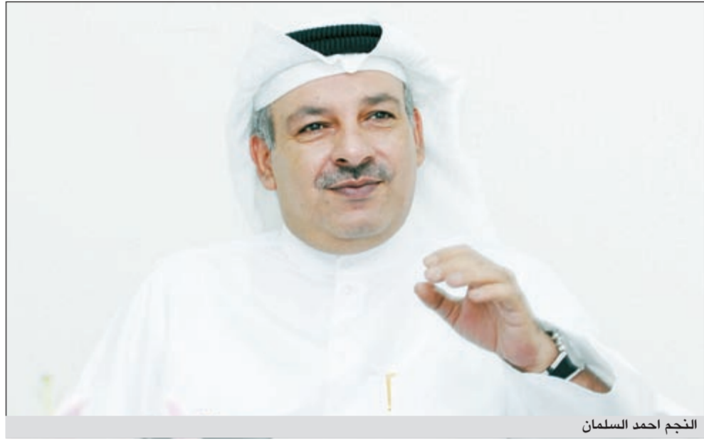
النجم احمد السلمان

فقط بفنهم وبرسالتهم التي يريدون إيصالها للناس. ضخم كمنتج منفذ بدعم من المجلس الوطني للثقافة والفنون والآداب ويحمل اسم «حاكم الليل»، حيث ينتظر إجازته من