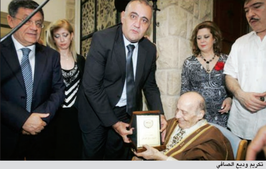
تكريم وديع الصافي

مسيرتهم الفنية. وتحدث جورج نجل الصافي عن معاني التكريم، فقال، بحسب «سيدتي نت»: «التكريم جميل بعد مسيرة تعب وجهد كبير، قدمها الصافي للبنان، والحمد لله أن هناك من يقدر هذا الأمر». وأضاف: «كان يحب أن يحضر والذي هذا التكريم، فهو مازال يحسب الجميع، وكنا قد بدرنا الأمور لكي يأتي الي الحفل، إلا أننا خفنا على صحته وارتأينا من الأفضل ألا يأتي، فهو موجود معنا وأمانة بين أيدينا، لكنه سيبقى حاضراً معنا بحبته وأغانيه».