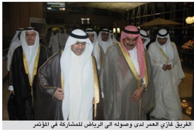
الفريق غازي العمر لدى وصوله الى الرياض للمشاركة في المؤتمر