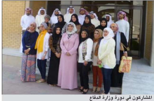
المشاركون في دورة وزارة الدفاع