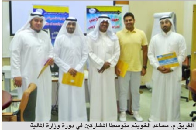
الفريق م. مساعد الغوينم متوسلاً المشاركين في دورة وزارة المالية

الأمن والسلامة والتي نظمت لمواطني ومسؤولين في وزارة المالية، إلى أن ارتكاب جرائم السطو وشتى الجرائم الأخرى تحت تأثير المواد المخدرة لا يعفي مرتكبيها من العقوبة بل إن هؤلاء المتهمين الواقفين تحت تأثير المواد المخدرة يواجهون تهماً أخرى تتعلق بتعاطي المواد المخدرة إلى جانب الجرائم الأخرى التي نفذوها. وكانت دورة المهارات الأساسية شارك في لقاء المحاضرات فيها العقيد م. داود الكندري والعقيد م. ربيع المطيري وتهدف إلى تدريب المسؤولين على القيام بواجبات ومهام الرقابة على أعمال الأمن واكتساب مهارات تؤهلهم لاحكام السيطرة وتأمين المنشآت التي يعملون فيها. وتضمن الدور محاور عدة منها أمن المنشآت والعوامل التي تؤثر على أمن المنشآت البنكية وتقنيات وسائل تأمين المنشآت إلى جانب أهمية تطبيق الوسائل الحديثة في التفتيش وتنمية الحس