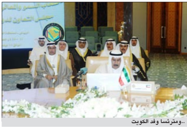
..ومترئسا وفد الكويت