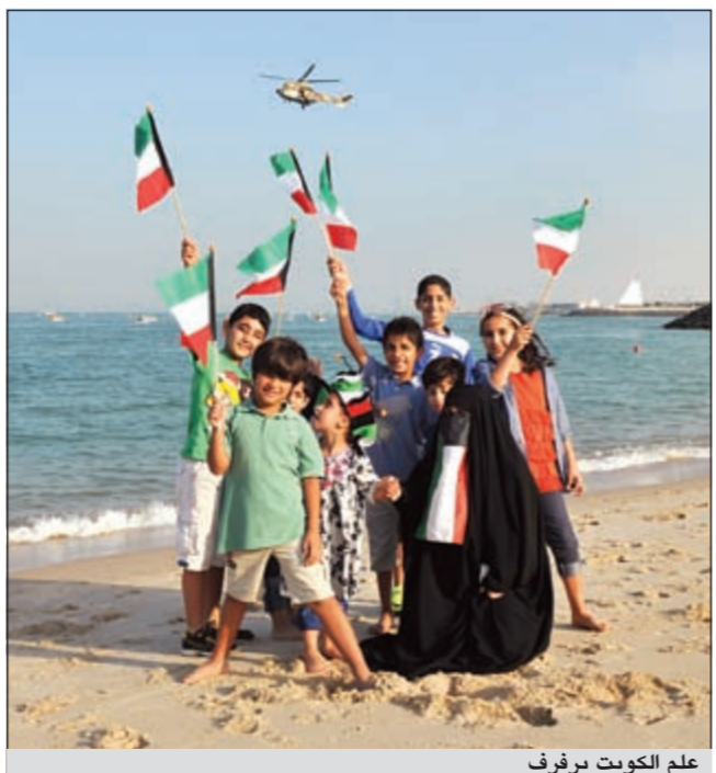
علم الكويت يرفرف