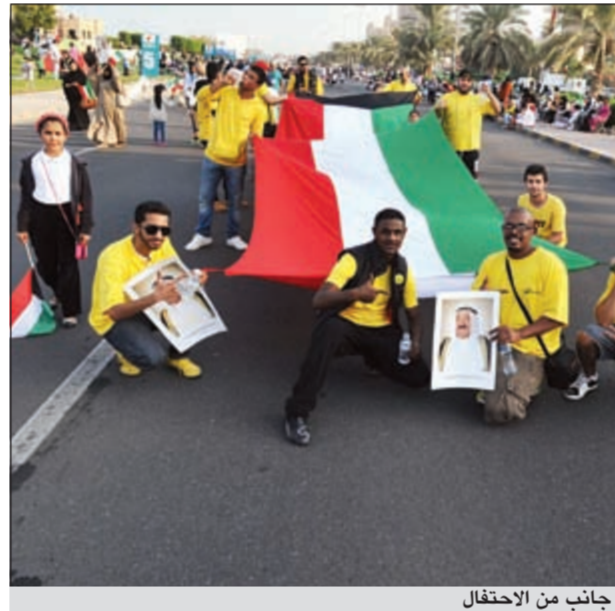
جانب من الاحتفال