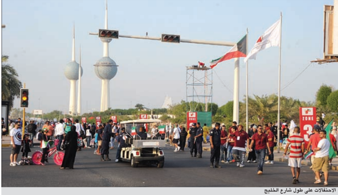
الاحتفالات على طول شارع الخليج