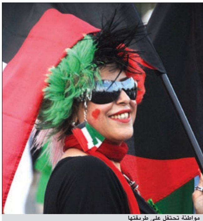
مواطنة تحتفل على طريقته