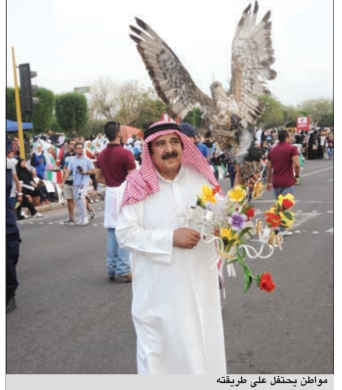
مواطن يحتفل على طريقته