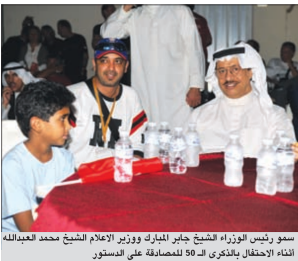
سمو رئيس الوزراء الشيخ جابر المبارك ووزير الإعلام الشيخ محمد عبدالله أثناء الاحتفال بالذكرى الـ 50 للمصادقة على الدستور

أما مشاري الحسيني والذي حضر هو الآخر بدوره مع عائلته فأكد على أن الاحتفال بهذا اليوم لا يقل أهمية عن الاحتفال والمشاركة في عيدي التحرير والاستقلال موضحاً: نصف قرن من عمر بلدنا مع الديمقراطية ولا شك هو أمر يستحق أن تحتفل به، فهذا هو اليوبيل الذهبي للاحتفال بالدستور وإقراره وأنا أتمنى أن يحتفل الجميع بهذه المناسبة وأن أرى الجميع على ساحل البحر، فهذا الاحتفال يعني جميع الكويتيين وأضاف الحسيني أحب أن تؤكد في هذه المناسبة أن الربيع الكويتي قد انطلق منذ نصف قرن، فربيعنا الكويتي جاء بالتراضي بين الحاكم والمحكوم والمصلحة البلد، وهو ما قام به المغفور له بإذن الله تعالى الشيخ عبدالله السالم وأدخل البلاد في عهد الديمقراطية الذي نعيشه منذ 50 عاماً. بدوره وصف أحمد الكندري ما يحدث بأنه مسيرة شعبية في حب الديمقراطية