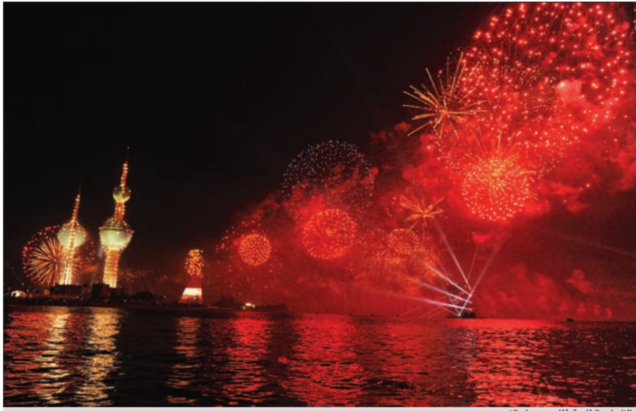
اللعاب النارية أثارت سماء الكويت

ولادة الدستور الكويتي، والذي معه تحولنا إلى دولة مدنية ودولة مؤسسات حقيقية والحرية مكفولة للجميع في التعبير والرأي في كل المجالات، لذا نحن ربيعيًا الكويتي بدأ منذ إقرار الدستور والمصادقة عليه.