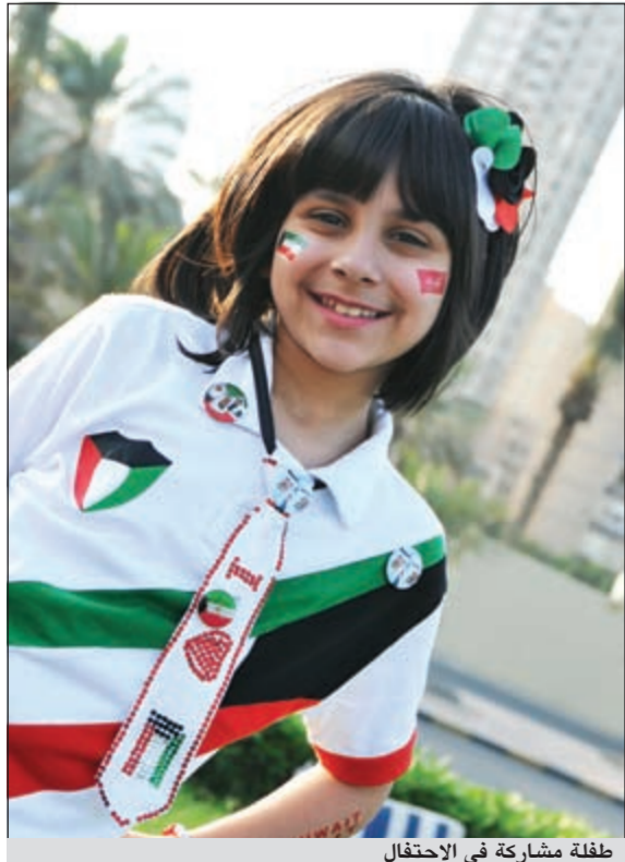
طفلة مشاركة في الاحتفال