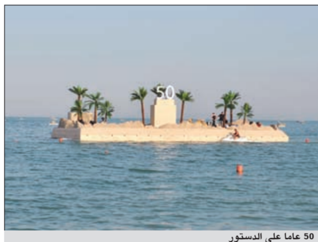
50 عاماً على الدستور

جميعاً مع الكويت، ونرفض ما يهدد أمنها وسلامتها ونتمنى من جميع الشعب الكويتي أن