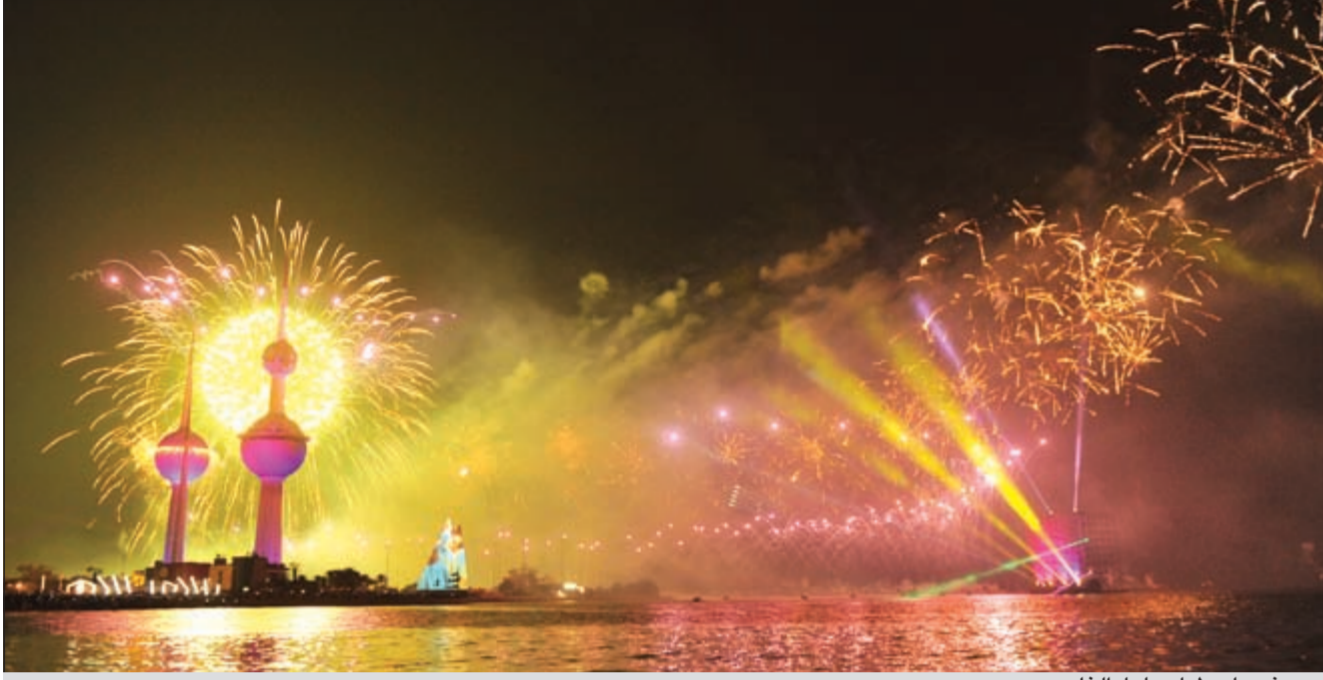
عروض على طول ساحل الخليج