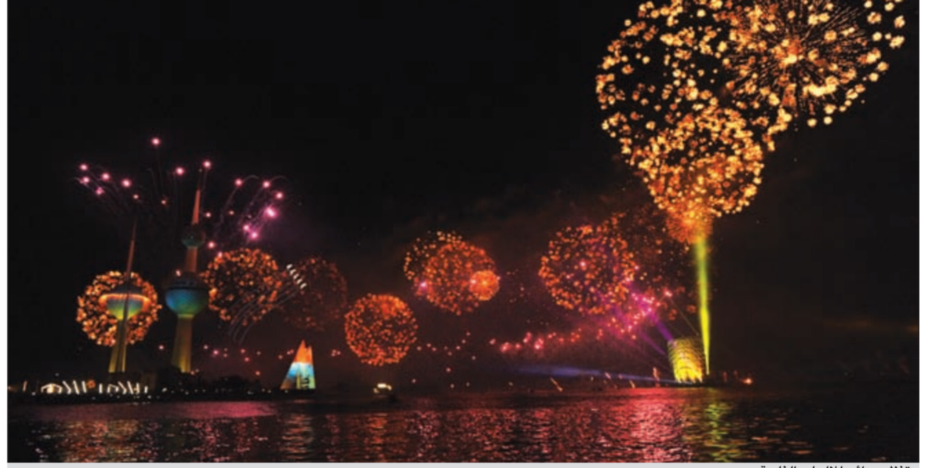
تنظيم رائع للألعاب النارية