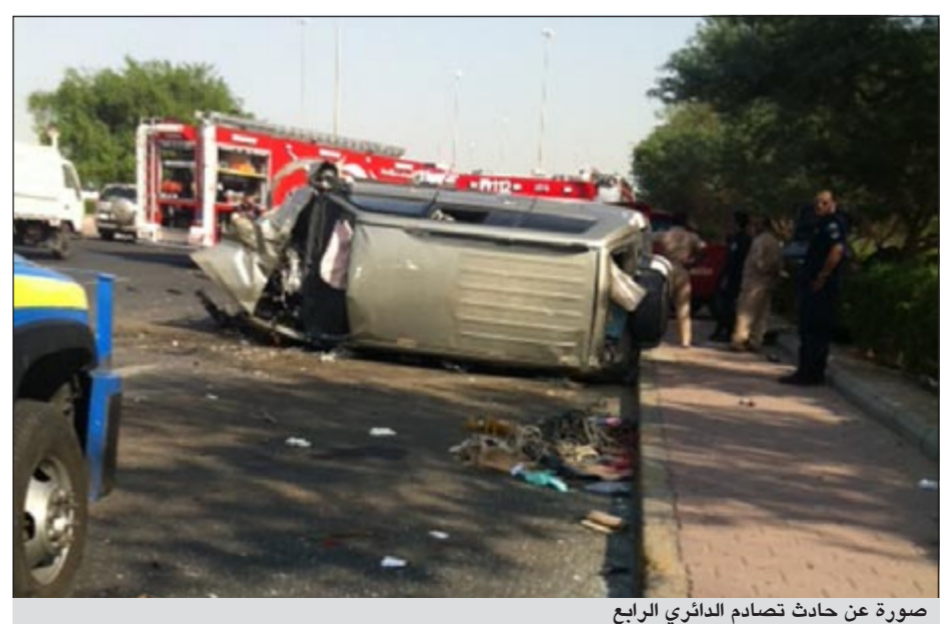
صورة عن حادث تصادم الدائري الرابع