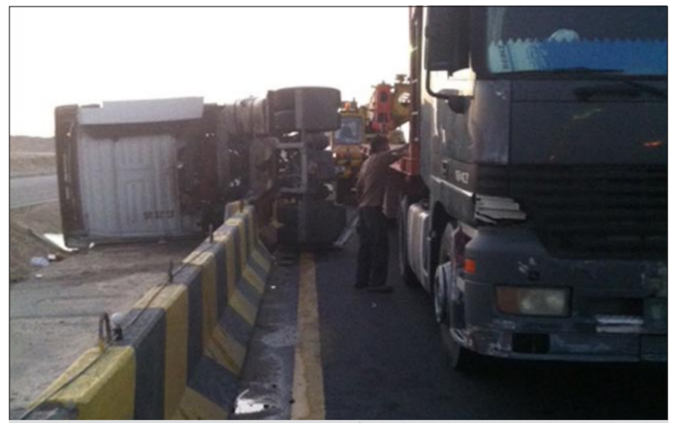
انقلاب شاحنة يعرقل حركة السير على طريق الملك فهد