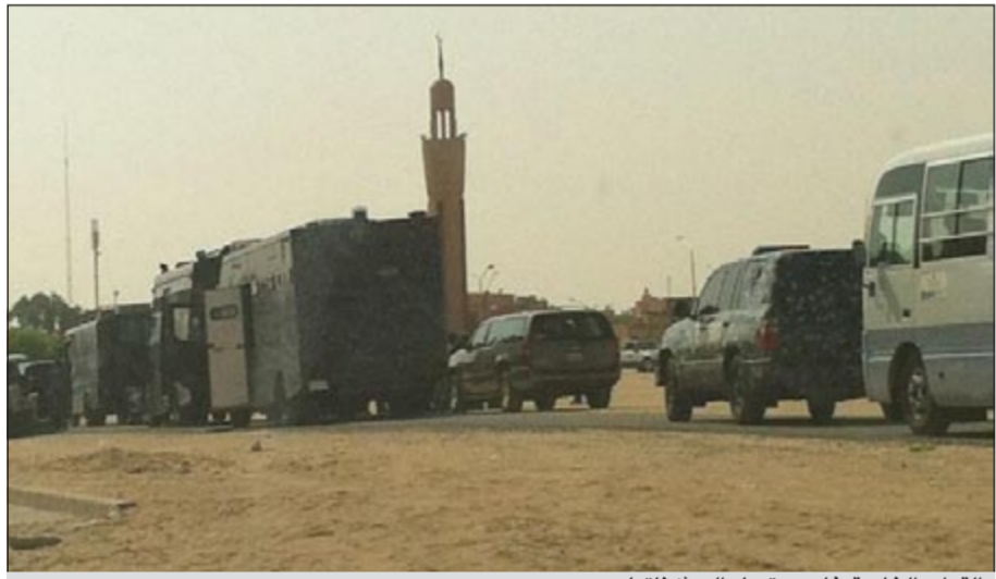
القوات الخاصة غادرت تيماء إلى ثكناتها

التوجه إلى مقر عملها، وأشاد مصدر أمني بعدم تجاوب البدون مع أي دعوات للمظاهر أو التجمع، مؤكداً أن وزارة الداخلية لن تسمح بأي تجمعات أو تظاهرات غير مرخصة للبدون.