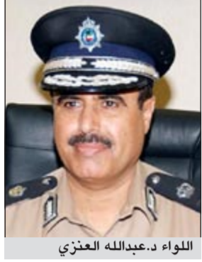
اللواء د.عبدالله العنزي

غادر البلاد صباح امس وكيل وزارة الداخلية الفريق غازي العمر متجها الى الرياض بالمملكة العربية السعودية للمشاركة في اجتماع وكلاء وزارات الداخلية بمجلس التعاون لدول الخليج العربية الذي يعقد في الفترة من 9 الى 11 الجاري وذلك للتحضير للاجتماع الـ 31 لاصحاب السمو ولوزراء داخلية دول المجلس، والذي من المقرر ان يتم خلاله بحث ومناقشة اوراق العمل المقدمة واعتماد مشاريع الخطط وغيرها من المواضيع التي سيتم ادراجها على جدول اعمال اجتماع وزراء داخلية دول المجلس والذي يعقد خلال الفترة من 12 الى 14 الجاري وذلك تمهيدا لإقرارها واعتمادها والتي قطعت اشواطاً كبيرة نحو تعزيز آليات ووسائل دعم