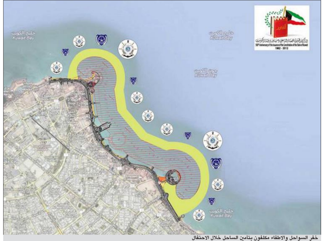
خفر السواحل والاطفاء مكلفون بتأمين الساحل خلال الاحتفال

رقم 1880888 للرد على أي أسئلة أو استفسارات عملا على راحة الجميع وتأمين سلامتهم خلال فعاليات الاحتفالية. وأكد اللواء الشيخ محمد يوسف أن قطاع العامة لخفر السواحل المتواجدة في منطقة العرض، مع ضرورة أخذ الحيطة والحذر. ودعا اللواء الشيخ يوسف إلى ضرورة الاتصال على هاتف العمليات بالإدارة العامة لخفر السواحل