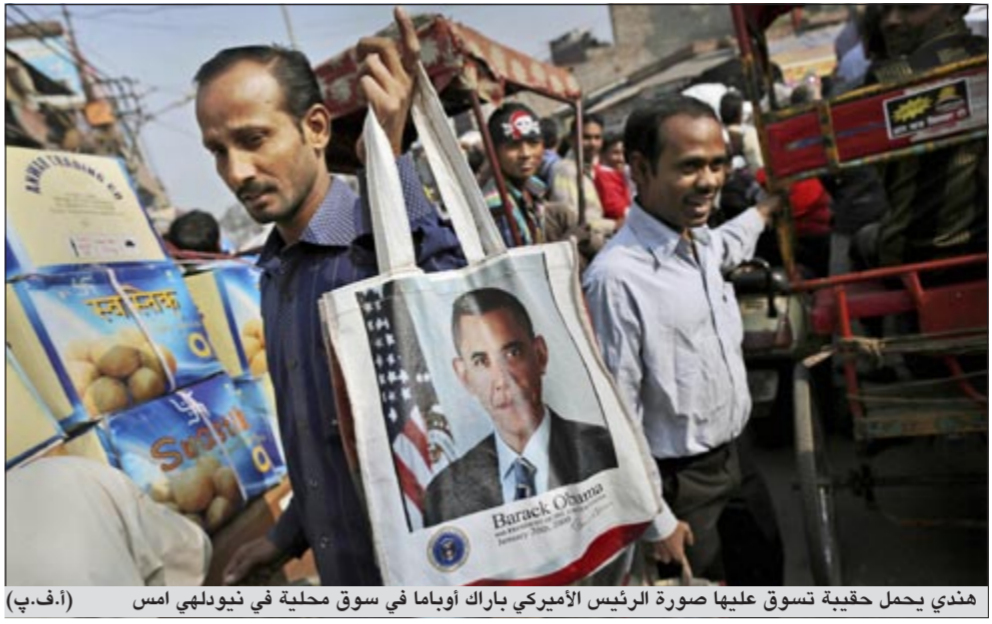
هندي يحمل حقيبة تسوق عليها صورة الرئيس الأميركي باراك أوباما في سوق محلية في نيولبي اس

واشنطن - وكالات: أفاد كبير مساعدي الرئيس الأميركي باراك أوباما في فلوريدا أمس الأول بفوز الرئيس في انتخابات الولاية حيث يواجه المسؤولون انتقادات شديدة لسوء تنظيم عمليات فرز الأصوات فيها. واعلن فوز أوباما في الانتخابات التي جرت الثلاثاء دون انتظار صدور نتائج فلوريدا بعدما فاز في عدد كاف من الولايات ضامنا أصوات 303 من كبار الناخبين، غير أن فريقه يبيد بأنه فاز أيضا في فلوريدا. وقال رئيس الديموقراطيين في فلوريدا رود سميت في بيان «باسم ديموقراطي فلوريدا، أود أن اهنيء الرئيس باراك أوباما على إعادة انتخابه وعلى فوزه بأصوات كبار ناخبي فلوريدا الـ 29».