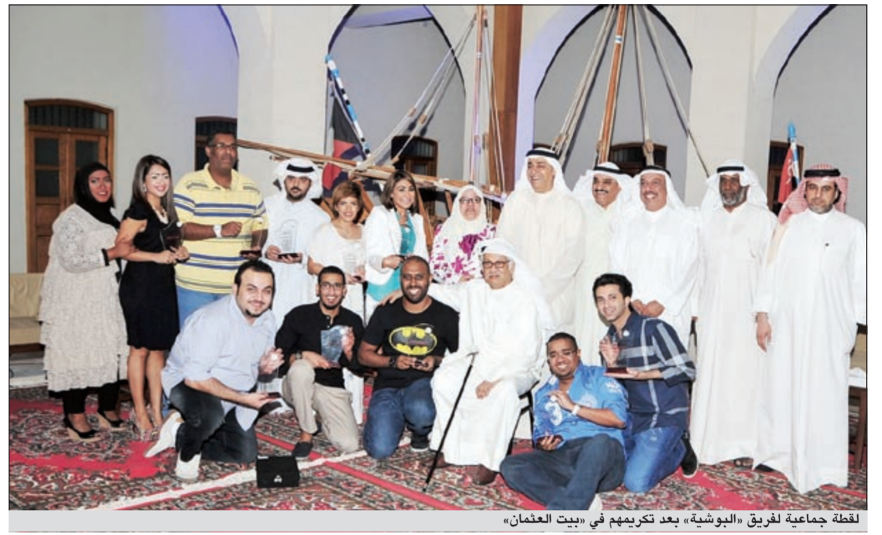
لقطة جماعية لفريق «البوشية» بعد تكريمهم في «بيت العثمان»

مخرج خليجي متضايق من كلام إحدى الممثلات الخليجيات في حقه بحوار صحافي كشفت فيه اخلاقيات في الاعمال اللي يخرجه.. زين تسوي فيك!