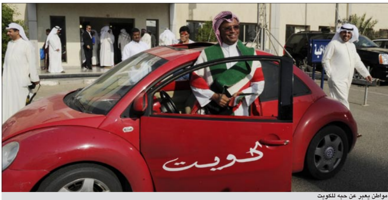
مواطن يعبر عن حبه للكويت

كانت درة للخليج والأم الحاضنة لنا. ووجه رسالة الى المقاطعين بضرورة تلبية دعوة صاحب السمو الأمير والترشح من أجل مصلحة الوطن والمواطن، معتبراً ان قرار سمو الأمير بإصدار مرسوم ضرورة بالصوت الواحد أمر حكيم وعلينا احترام هذا القرار.