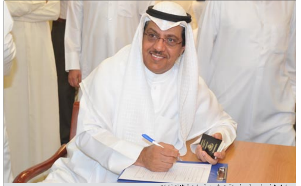
مبارك الخريجين يقدم أوراق ترشحه في إدارة الانتخابات

387 مرشحاً يخوضون الانتخابات بينهم 14 امرأة