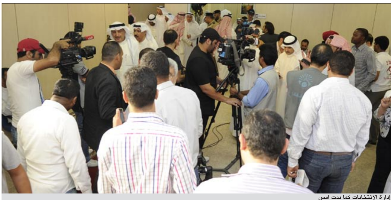
إدارة الانتخابات كما بدت امس