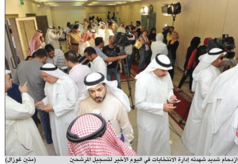
ازدحام شديد شهده إدارة الانتخابات في اليوم الأخير لتسجيل المرشحين (متين غوزال)

بلغ عدد المقيدون في انتخابات 2012/2 (287) مرشحاً من بينهم 22 امرأة. كما بلغ عدد المقيدون في انتخابات 2009 (282) مرشحاً من ضمنهم 21 امرأة. وسجل في انتخابات 2008 (275) مرشحاً من بينهم 27 امرأة.