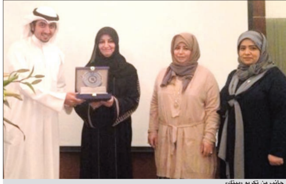
جانبا من تكريم «بيتك»