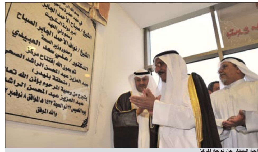
إزاحة الستار عن لوحة المركز