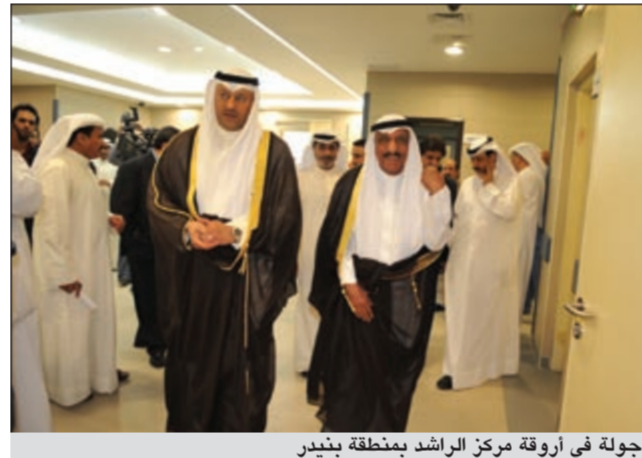
جولة في أروقة مركز الراشد بمنطقة بنيدر

على أن الطيران العمودي الخاص بالإنقاذ الجوي يسير بخطى حثيثة مبيئا أنه تم الحصول على موافقات مبدئية، كما أعرب عن أمه أن العام القادم سيشهد ولغت في الوقت نفسه إلى أن الموضوع سيأخذ طارده الخاص، حيث ستتقدم الوزارة بمبالغ كبيرة حال شراء طائرات ولهذا فمن الأفضل أن يتم الأمر بتعاون مع القطاع الخاص على حسب ساعات الاستخدام وأكد البدء في طرح المناقصات بعد اخذ موافقة من لجنة المناقصات المركزية.