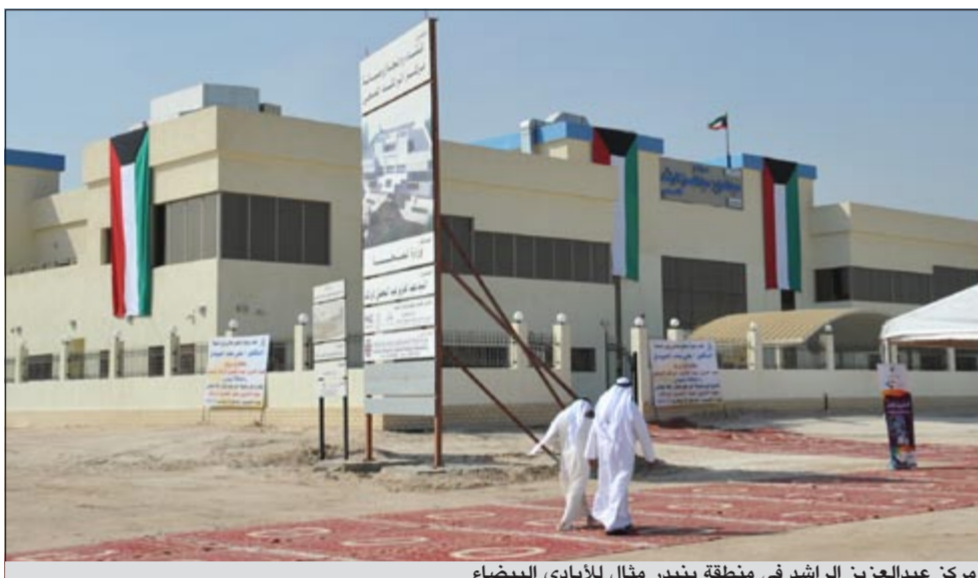
مركز عبدالعزيز الراشد في منطقة بنيدر مثال للأبواب البيضاء