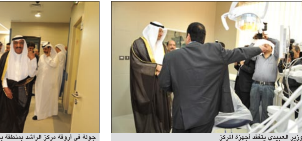
الوزير العبيدي يتفقد أجهزة المركز

من جانبه أكد وكيل وزارة الصحة د.خالد السهلاوي أن المنطقة التي يقع بها المركز تبعد عن أقرب مستشفى، وهي العبدان بوقت كبير ولهذا تم تجهيز غرفة طوارئ نظرا لتخوع الحالات، حيث إن بعضها يستدعي دخول المستشفى، وحالات أخرى يمكن لطبيب الطوارئ علاجها داخل العيادة مثل الإصابة بضربة شمس أو لدغ الحشرات والجفاف والاختناقات البسيطة، وهي أمور يمكن التعامل معها خاصة في فترة الصيف وأشار إلى أن المركز يضم عيادة أسنان ومختبرا لمرضى الأمراض المزمنة لإجراء الفحوصات حيث يحتاجون إليها في الإجازات الأسبوعية للمتابعة.