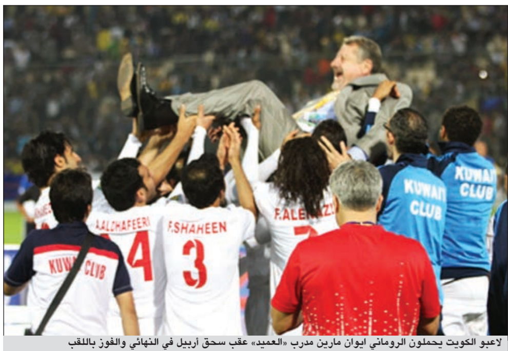
لاعبو الكويت يحملون الروماني ايوان مارين مدير «العميد» عقب سحق أربيل في النهائي والفوز باللقب

القحطاني: أعزب بهدفي في مرمى الاتفاق.. ومارين سر تألقي وتطور مستواي