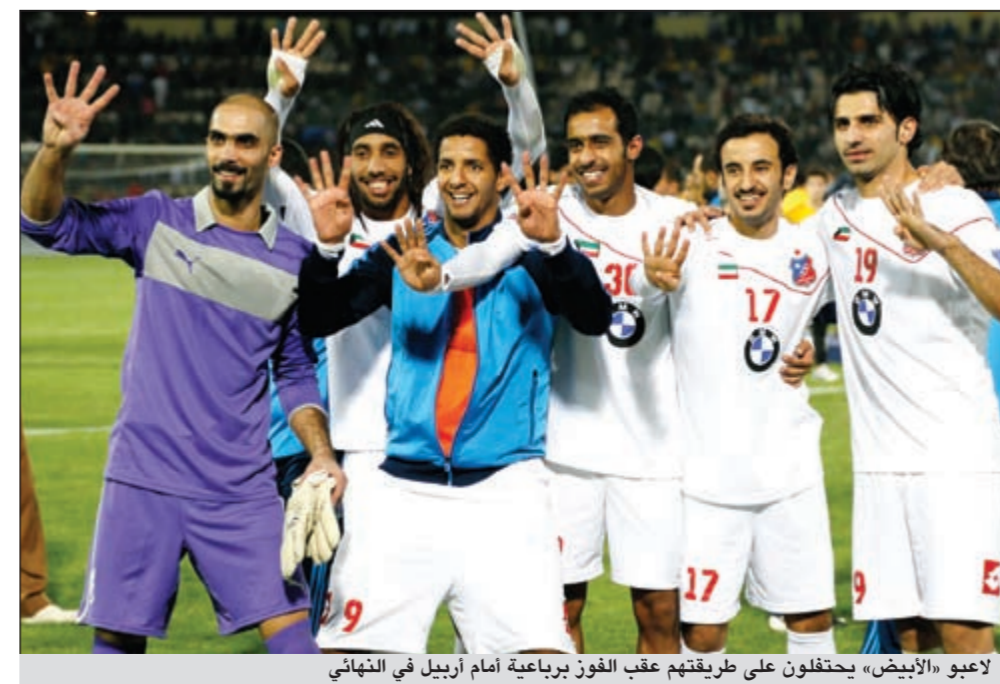
لاعبو «الأبيض» يحتفلون على طريقتهم عقب الفوز برعاية أمام أربيل في النهائي