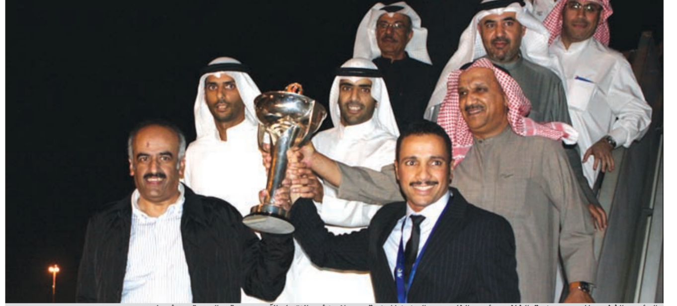
الرئيس الفخري للعميد مرزوق الغانم ورئيس النادي عبدالعزيز المرزوق يحلمان كأس الاتحاد الآسيوي عقب العودة من أربيل