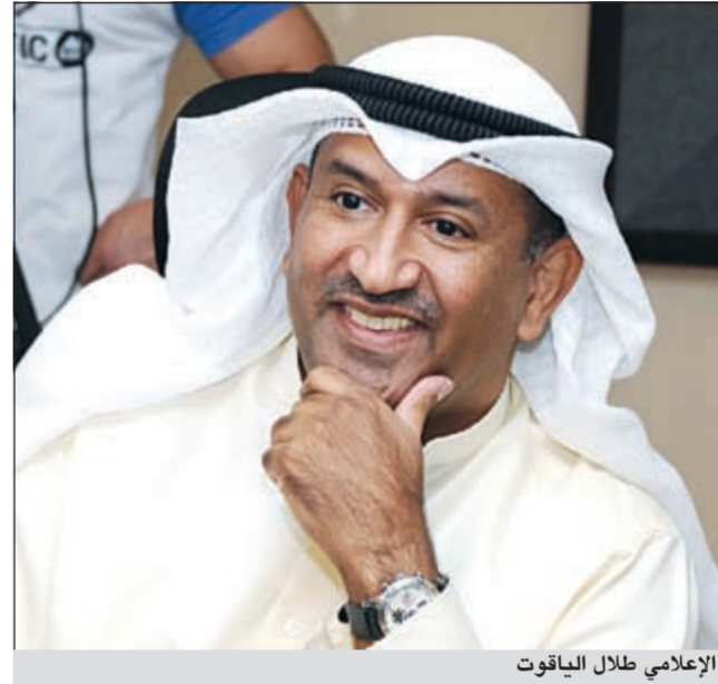
الإعلامي طلال الياقوت

في إطار حرصه على متابعة كل كبيرة وصغيرة تحدث في الكويت ودعمًا للشباب الطامح في مستقبل أفضل، يستمر برنامج «القايلة» في التواصل مع الجمهور من كل الفئات العمرية، حيث بث البرنامج أمس «الإربعاء» حلقة خاصة من كلية العلوم الإدارية - بدعوة من نادي الإدارة والتسويق في الكلية - نقل خلالها مقدما البرنامج الإعلامي طلال الياقوت والمذيع المتألق مايك مبلتع الكثير من الآراء البناءة وتحدث الطلاب خلال الحلقة بدون حواجز عن بعض المشاكل التي تعترض طريقهم وطموحاتهم المستقبلية.