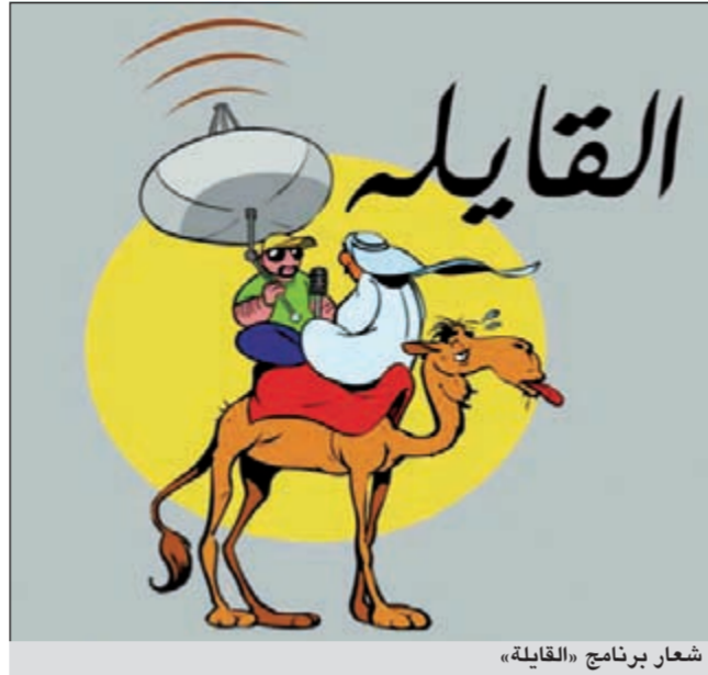
شعار برنامج «القايلة»