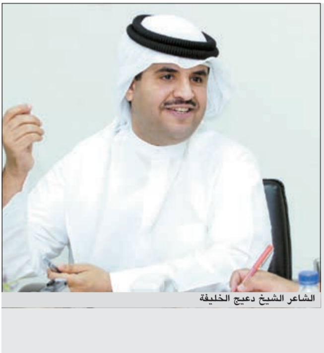
الشاعر الشيخ دعيج الخليفة

ووجهات نظرم بكل شفافية، مؤكداً أن فريق البرنامج لا يالو جهداً في سبيل هذه الغاية ومستمر في التواصل مع الجمهور من خلال صفحاتهم على «تويتر» وهي @Gaaylaa. من جانبه، قال المذيع مايك مبلتع: لا تزال نسير في طريقنا