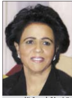
الشيخة فريحة الأحمد

أكدت رئيسة الجمعية الكويتية للأسرة المثالية الشيخة فريحة الأحمد على ضرورة تطبيق ما جاء في الخطاب السامي لصاحب السمو الأمير في لقائه مع شرائح من المجتمع الكويتي، وذكرت في تصريح لوسائل الإعلام أن صاحب السمو الأمير الشيخ صباح الأحمد جمع في ديوانه كل شرائح ومكونات وطوائف المجتمع ولم يستثن أحداً مما يؤكد على عدالته في مخاطبة الشعب الكويتي المحب لكل شافية من مطلق أيوتة للجميع. وقالت الأحمد أن ما ذكره الأمير من تطبيق القانون واحترام الدستور وعدم القفز على صلاحياته من أهم عوامل استقرار البلاد حيث حدد الدستور صلاحيات الحاكم ومجلس الأمة وأنه لم ينطق إلا من خلال ما يراه من مصلحة البلد ومستقبله. وأضافت أن الخروج على الأمير والدعوة إلى العصيان والتظاهر ورفض المرسوم دون اللجوء إلى القنوات القانونية والمحكمة الدستورية، سيضع البلد على صفيح ساخن وفوضى عارمة وفتنة تحرق القريب والبعيد وليس هناك ربح. وأكدت على أهمية تضامناً أفراد المجتمع والالتفاف حول قيادته لمواجهة التحديات العالمية والإقليمية التي تعني بالكيانات الصغيرة كدول الخليج وتهدد أمنه واستقراره وأجياله القادمة، مشيرة إلى ما يحدث في بعض دول الشرق الأوسط.