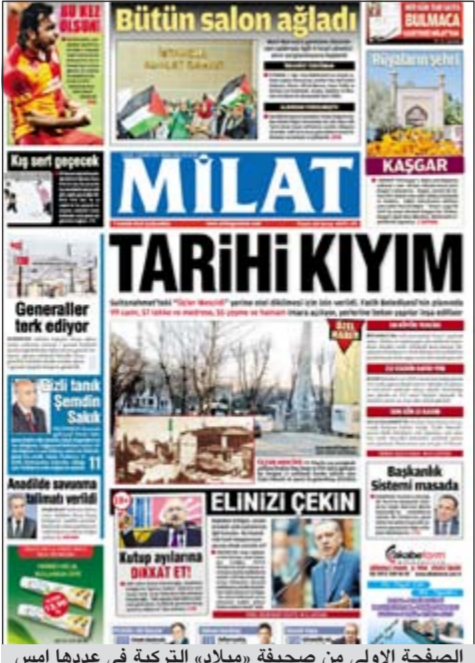
الصفحة الأولى من صحيفة «ميلاد» التركية في عددها أمس