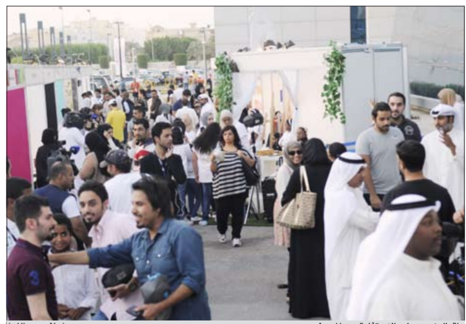
إقبال كبير على الاستفادة من المعرض (هاني عبدالله)

توفير امكان مجانية ودون اي تكاليف مادية عليهم، وفي ختام كلمته تقدم الفارسي بالشكر الى صاحب السمو الامير الشيخ صباح الاحمد لما قدمه من دعم للملتقى هوايتي كما شكر كل من ساهم في