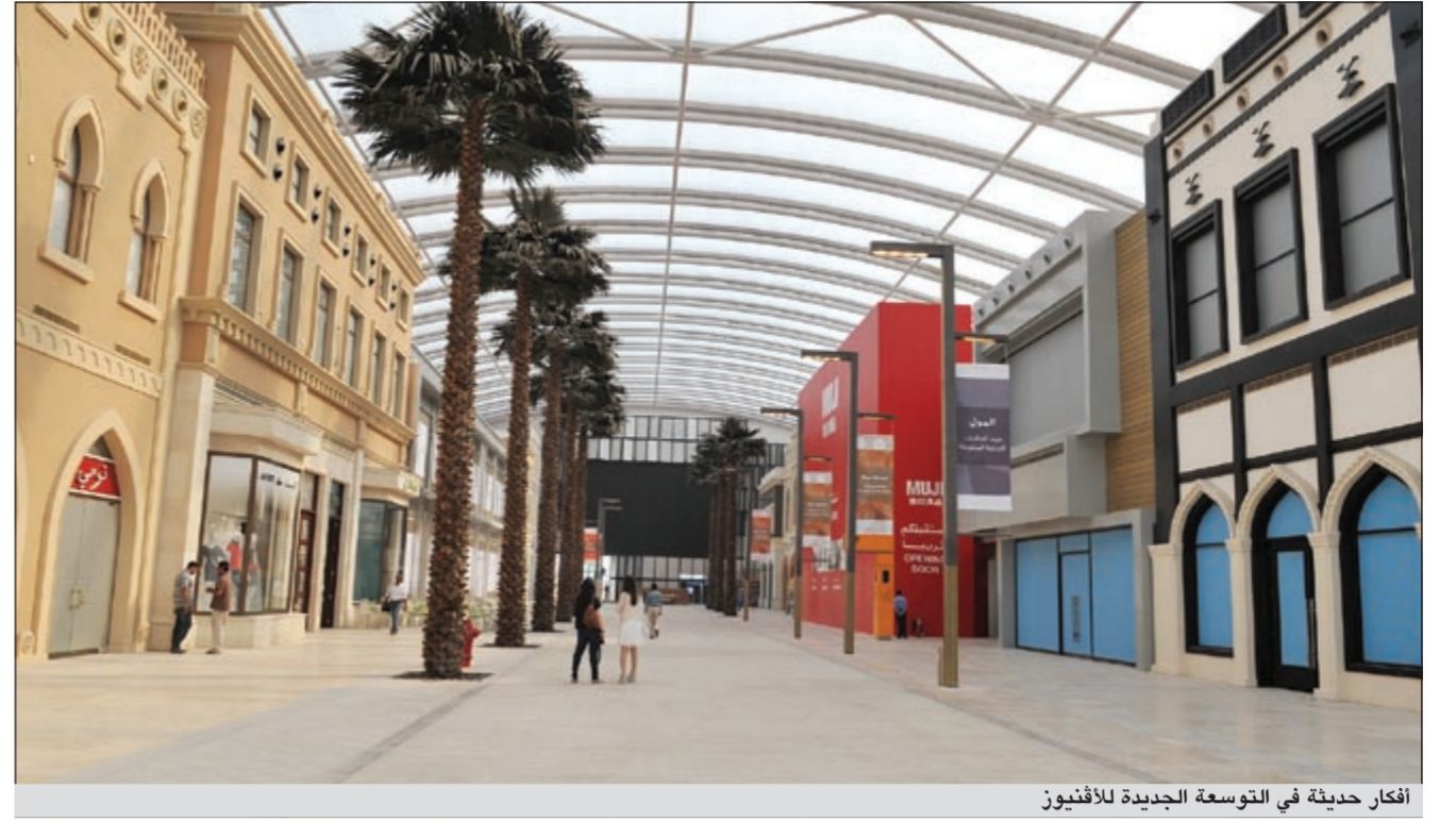
أفكار حديثة في التوسعة الجديدة للأفنيوز