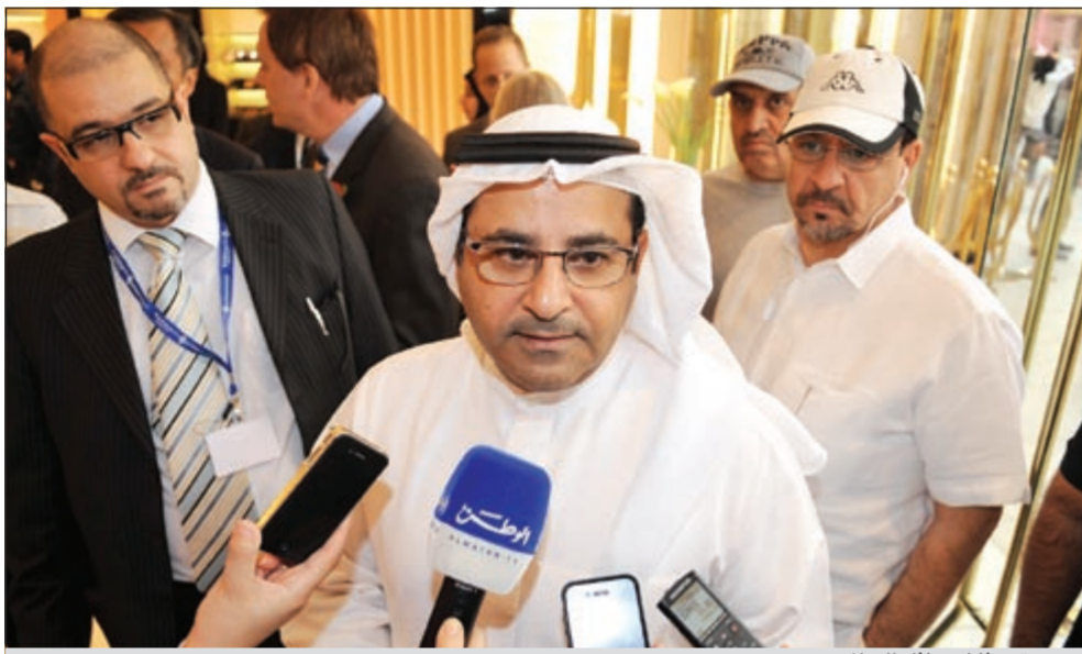
...ومتحدثا لوسائل الإعلام

والمسك وعدد كبير من مختلف العلامة التجارية JO MALONE الشهيرة في المملكة المتحدة والعالم وهي متخصصة في تقديم اجمل انواع العطور الاوروبية والشرقية المعاصرة حيث تستطيع في محلات جو مالون اختيار اطيب العطور وأجمل الروائح الزكية من العود والعنبر والمسك وعدد كبير من مختلف