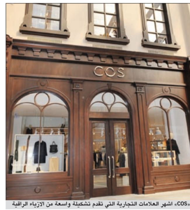
«COS» أشهر العلامات التجارية التي تقدم تشكيلة واسعة من الأزياء الراقية

أخرى في مختلف انحاء العالم مثل: سينغافورة، وهونغ كونغ، وماليزيا، كما تستمثل هذه الاتفاقية مع شركة الشايح توسعا جديدا للعلامة التجارية عبر أسواق الشرق الأوسط والمنطقة. تصميم عمراني خلاب وتتميز المناطق الجديدة بتصميم عمراني خلاب يجمع عدداً من المدارس العمرانية المتنوعة، يمنح كل منطقة هوية خاصة تختلف عن الأخرى والمستوحاة من عرق المدن في العالم مما يجعل من تجربة التسوق في الأفنيوز تجربة متجددة ومختلفة في كل مرة، كما تتميز بمزيج من العلامات التجارية المتنوعة من أشهر دور الأزياء العالمية والمطاعم والترفيه. وتبلغ المساحة التجارية للأفنيوز مع افتتاح المناطق الجديدة حوالي 270 الف متر مربع، ويتضمن أكثر من 800 محل تجاري، ومواقف سيارات تسع حوالي 10 الاف سيارة، وتغطي جميع المناطق الجديدة بمادة «أي تي أف أي» والتي تجعل