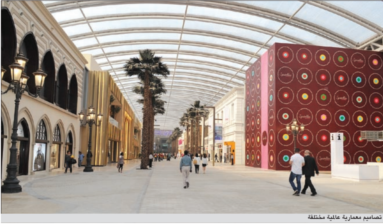
تصميم معمارية عالمية مختلفة