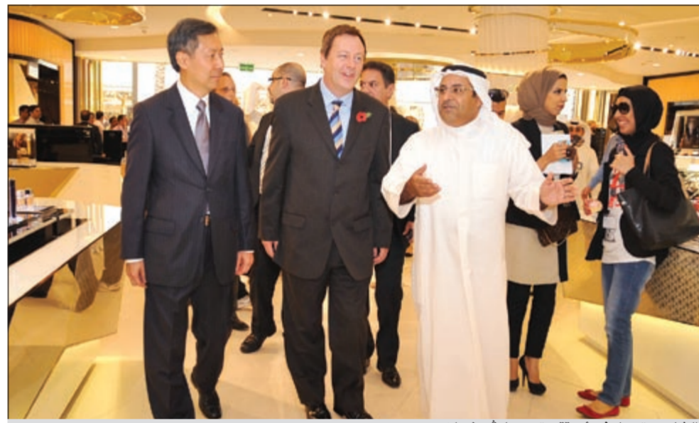
الشايح متجولا في اروقة متجر هارفي نيكلز

يوم من ضمنها قائمة 30 شهر اطباق حلوى التشنيز كيك. «وست إم»