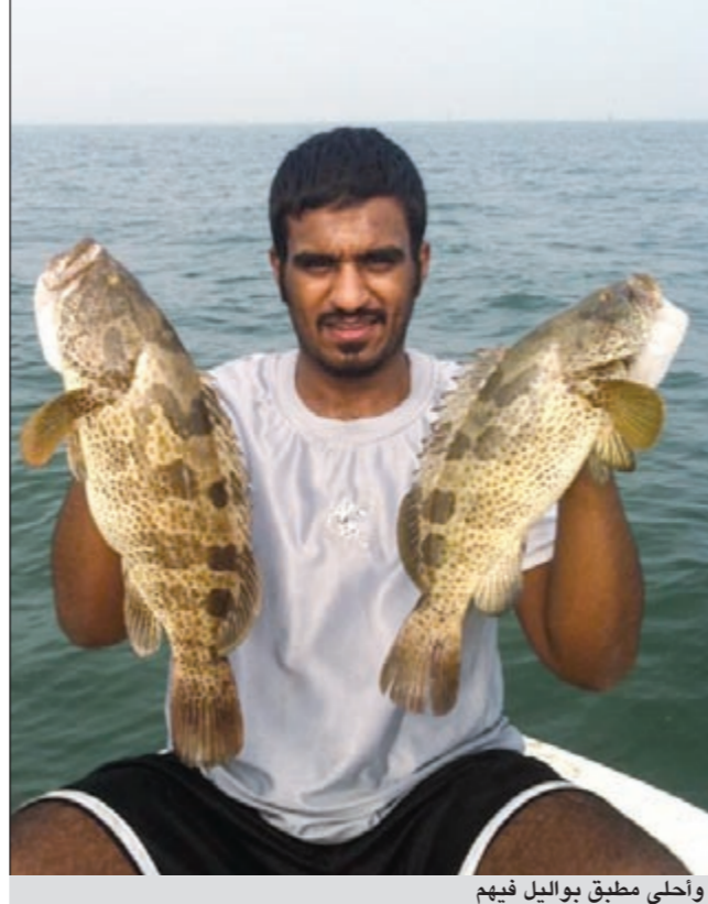
واحلى مطبق بواليل فيهم

التي تنعم باسمك والنقرور الركسة والفطاس اما بالنسبة لاسماك الفسكر فافضل الاماكن