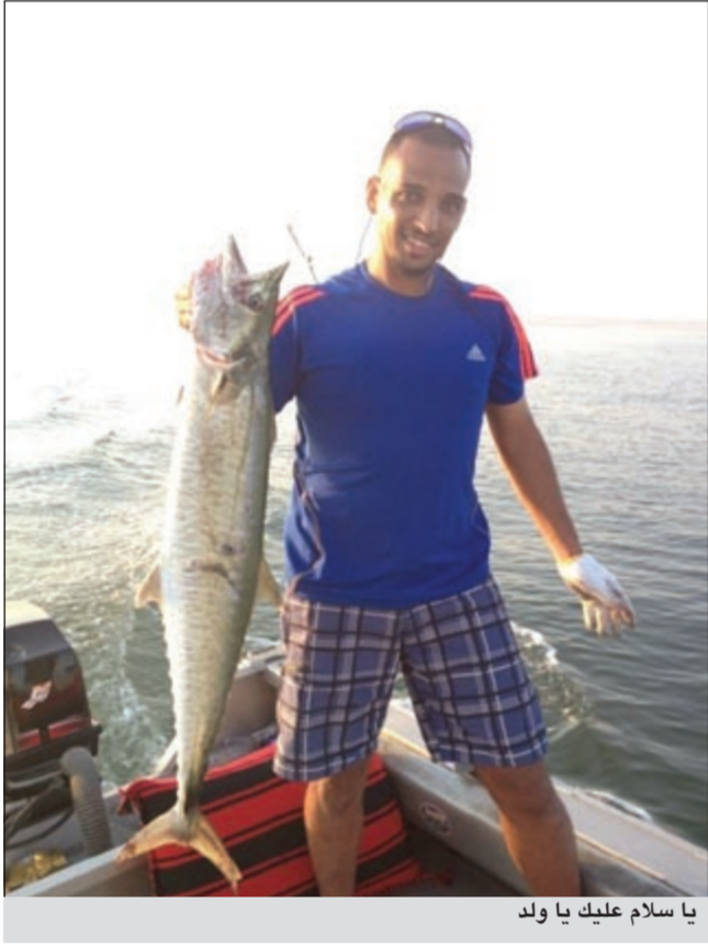
يا سلام عليك يا ولد

● نعم البحر ارزاق وفيه خير ولا ننسى أن البحر اعطي لاهلنا من قبل كل خير وعشوقه أكثر منا نحن هذا الجيل لأنهم يعرفون قيمته جيدا وذلك بسبب ان رزقهم اليومي كان من البحر ولكن بعد التطور الذي عاصرناه بخروج النقرور تغير الحال وترك البحر ودمر من البعض لأنه لدى البعض أصبح من الذكريات ولم يعد له قيمة لأن البديل وجد ولكن البحر لم ينس والدليل أن خيره لا يزال موجودا ولكنه في نفس الوقت يريد من يهتم ولو قليلا به ويحافظ عليه من بعض الأمور التي كثرت هذه الأيام مثل التلوث والقراقرير والمشايك لأنه إذا لم ينتبه البعض إلى البحر فسياتي يوم نلوم أنفسنا كثيرا على ما فعلناه به، وأنا واحد من الناس اعشق برزق البحر وتنوع خيره وأكثر ارزاق البحر التي ابحث عنها باستمرار اسمك