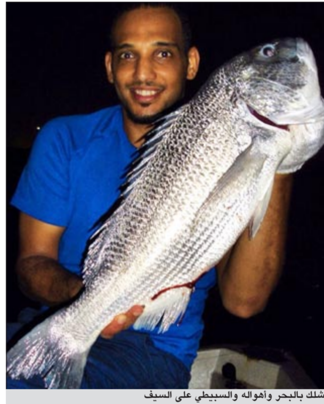
شك بالبحر واهواله والسبيطي على السيف