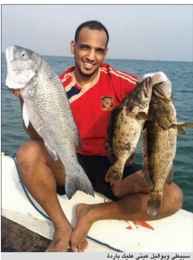
سبيطي وبواليل عيني عليك باردة

هل فكرت انك تجرب طرقا مختلفة بالصيد غير الخيظ واين تمارسها؟