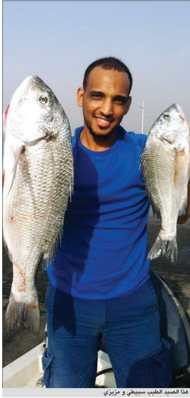
هذا الصيد الطيب سبيطي و مزيبي