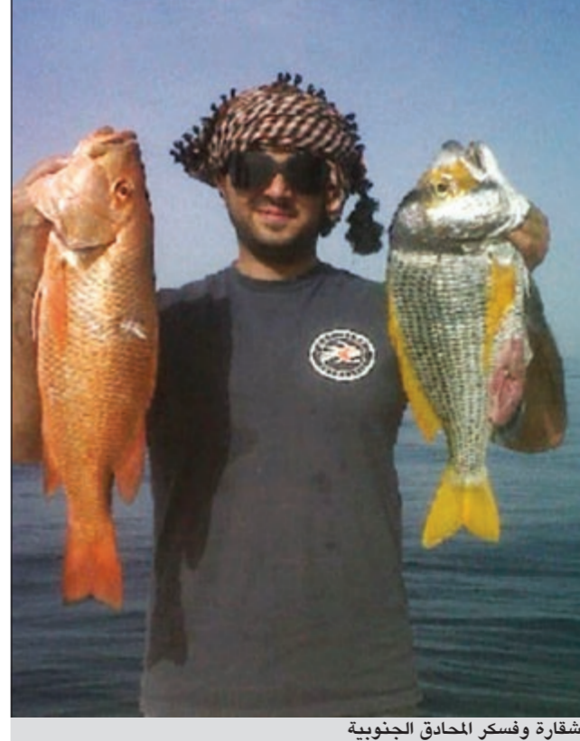
شقارة وفسكر الحدائق الجنوبية