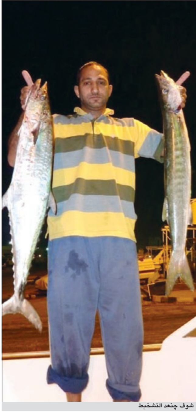
شوف جعند التشخيظ